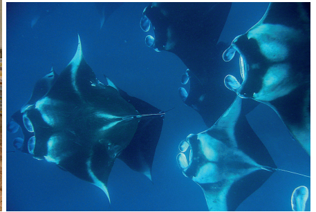
В The Nautilus цвет имеет особое значение: песок – белый, вода – бирюзовая, спины гигантских мант – черные с узорами

С высоты птичьего полета Мальдивы видятся изумрудно-голубыми, с сапфировыми просторами океана и отмелями цвета турмалинов параиба. Но у доктора Ибрагима Умара Манику — мальдивского предпринимателя, оказавшего колоссальное влияние на развитие отельного бизнеса в архипелаге, — был иной взгляд. Свой лучший и последний проект — курорт The Nautilus на атолле Баа он задумал лавандовым.