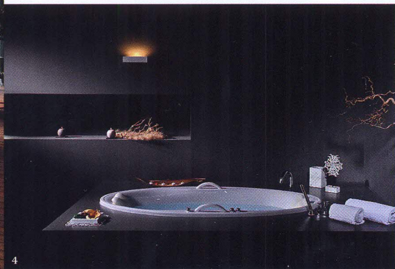
1 ЛОББИ ОТЕЛЯ LIDO PALACE. 2 ЛЕТНЯЯ ТЕРРАСА РЕСТОРАНА IL RE DELLA BUSA. 3 ИЗ СЬЮТОВ ГОСТИНИЦЫ ОТКРЫВАЕТСЯ ВИД НА ОЗЕРО ГАРДА. 4 ВАННАЯ КОМНАТА В СПА-СЬЮТЕ.