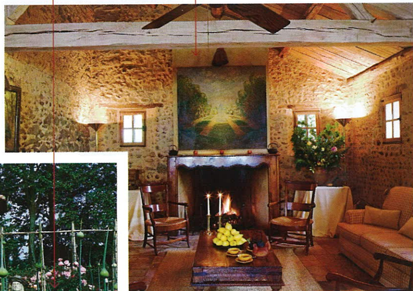
Ресторан La Ferme aux Grives – заведение с гасконским характером.

цы отеля постарались и создали нечто весьма впечатляющее. Во-первых, все процедуры здесь делаются на бионической греческой косметике, с которой до визита в «Элунду» лично я была совершенно незнакома. Между тем у них есть совершенно замечательные ноу-хау. Например, маски для волос, способствующие тому, чтобы ваша шевелюра не страдала от соленой воды и солнца. Эффект очевиден в буквальном смысле. Скрабы для тела, маски для лица и т. д. – все натуральное, пахнет фруктами и дает очень хороший эффект. В Spa Elounda Peninsula представлены практически любые процедуры – лично мне ежедневный интенсивный массаж и обертывания из водорослей помогли избежать негативных последствий валяжного семейного отдыха. А после процедур можно поплавать в бассейне с гидромассажем и чудесным видом на море и Спиналонгу, лениво раздумывая, куда отправиться на ужин – на автомобиле или лодочке.