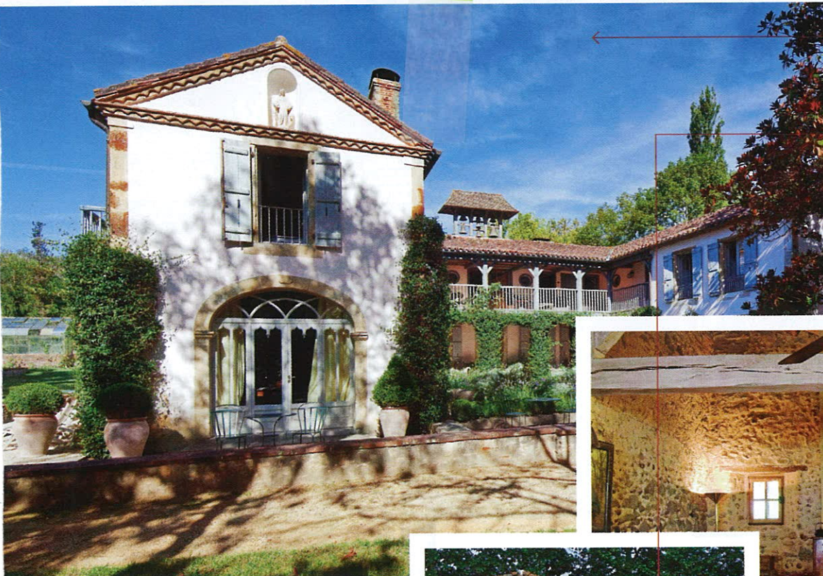
Couvent des Herbes – одна из восьми villas отеля Le Près d'Eugénie.