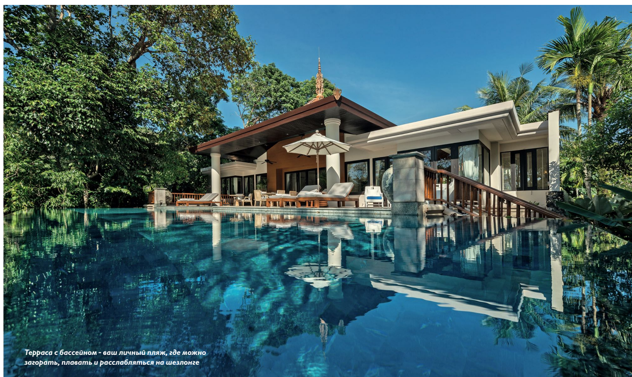
Терраса с бассейном - ваш личный пляж, где можно загорать, плавать и расслабляться на шезлонге

Вся обстановка курорта умиротворяет, но, чтобы расслабиться полностью, отправляйтесь в Jara Spa: релакс начинается еще с зоны ресепшн за чаем с медом и лимонграссом и достигает максимума во время процедур массажа, которые направлены на снятие напряжения и стресса – это, кстати, лучший способ восстановиться после перелета. Кроме того, в Trisara можно заниматься йогой, пилатесом и тайским боксом – дружелюбные и веселые инструкторы зарядят энергией и хорошим настроением даже тех, кто никогда не примерял боксерских перчаток.