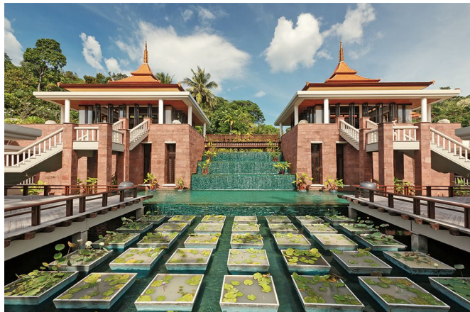
Завтраки на террасе с видом на залив с самого утра настраивают на умиротворенный лад