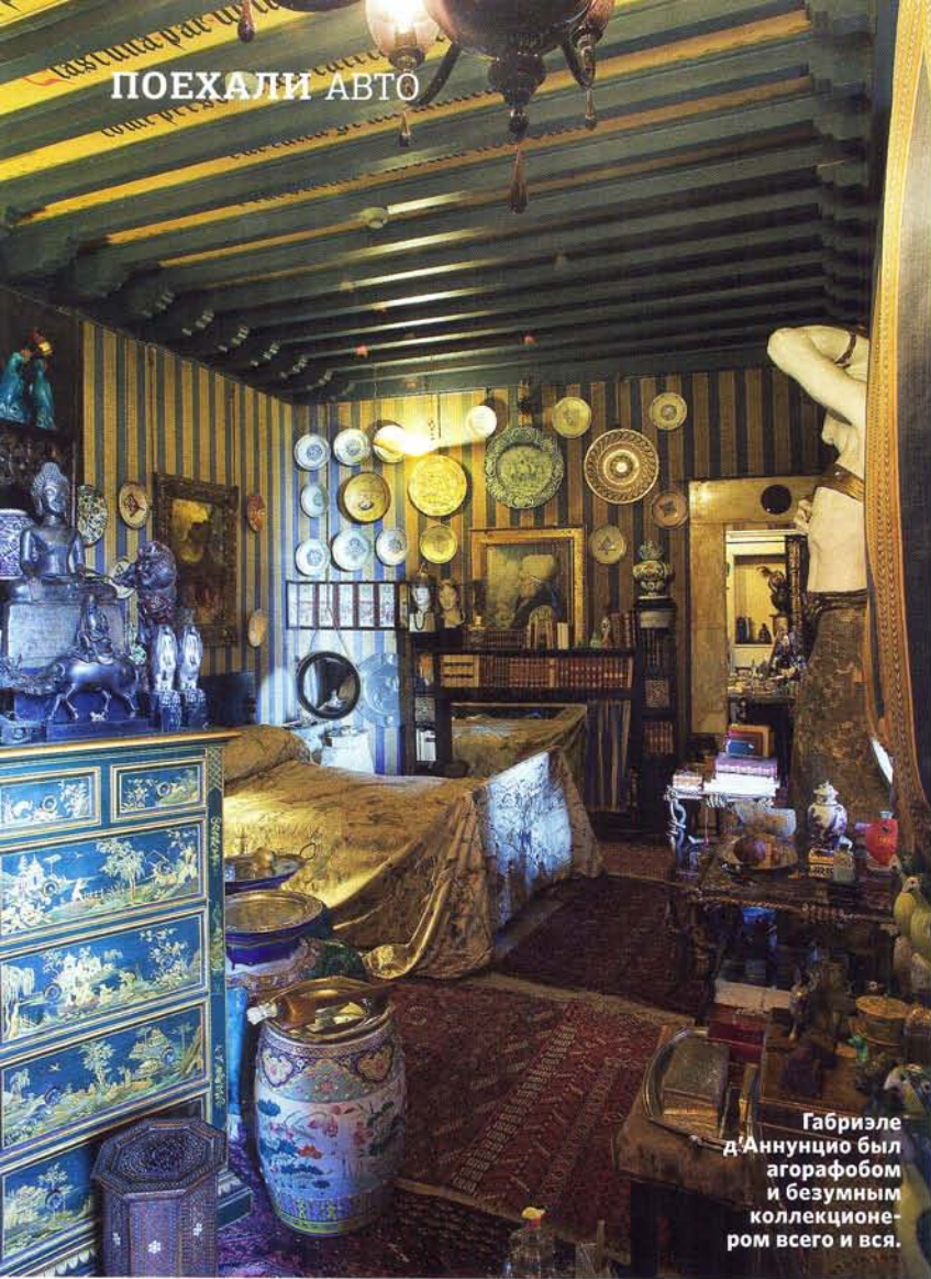
Габриэле д'Аннунцио был агорафобом и безумным коллекционером всего и вся.