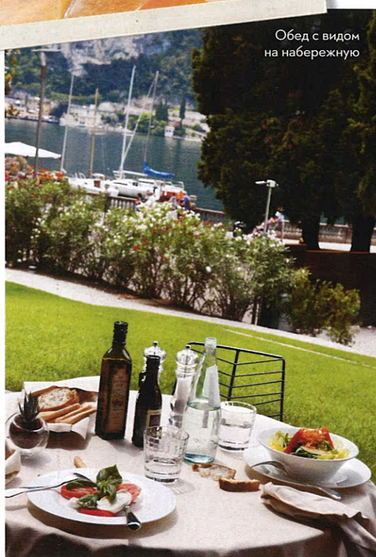
Обед с видом на набережную

Но вместо дворцовых интерьеров со старинными комодами гости попадают в современное фойе с огромными окнами, бирюзовыми диванами и абстрактными картинами. Словом, строгий снаружи палатко объявляет решительный бойкот обыденности и консерватизму внутри. Lido по праву гордится огромным спа-комплексом, сочетающим джакузи, несколько видов саун и бань, фитнес-центр и процедурные комнаты. Одна из них — соляная, со стеной, выложенной светящейся мозаикой из соляных кирпичей, убаюкивает, словно волшебная колыбелька. Впрочем, все здесь способствует успокоению и расслаблению. Даже вид с террасы ресторана открывается совершенно безмятежный: днем за чашечкой капучино можно бесконечно наслаждаться видом небольшого порта с яхтами и набережной с пальмовыми аллеями. ■■■