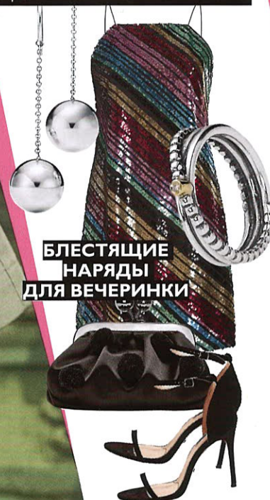
БЛЕСТЯЩИЕ НАРЯДЫ ДЛЯ ВЕЧЕРИНКИ