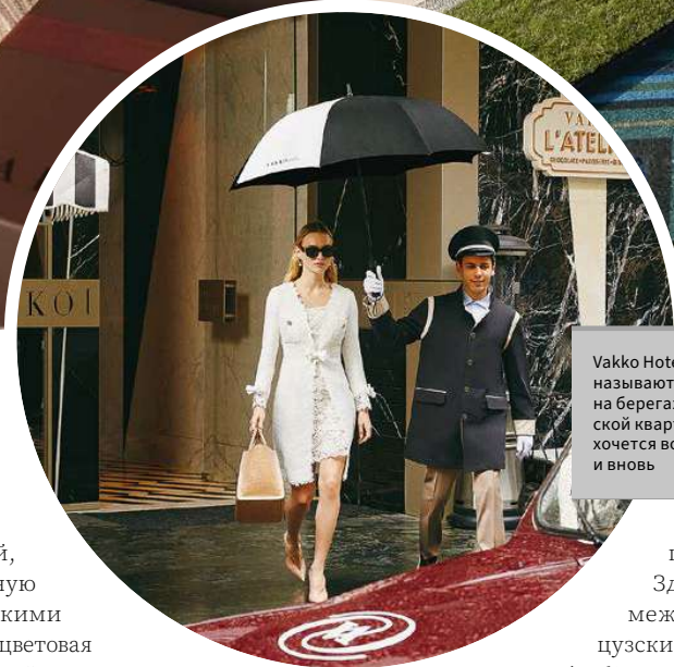
Vakko Hotel & Residence часто называют кусочком Парижа на берегах Босфора, стамбульской квартирой, куда гостям хочется возвращаться вновь и вновь

Vakko Hotel & Residence предлагает 30 сьютов площадью 95–198 кв. м. Каждый номер включает спальню, гардеробную, гостиную с обеденной зоной, полноценную кухню и мраморную ванную комнату с косметическими средствами Vakko. Нейтральная цветовая гамма, минималистичный дизайн и уютная мебель создают обстановку для безмятежного отдыха.