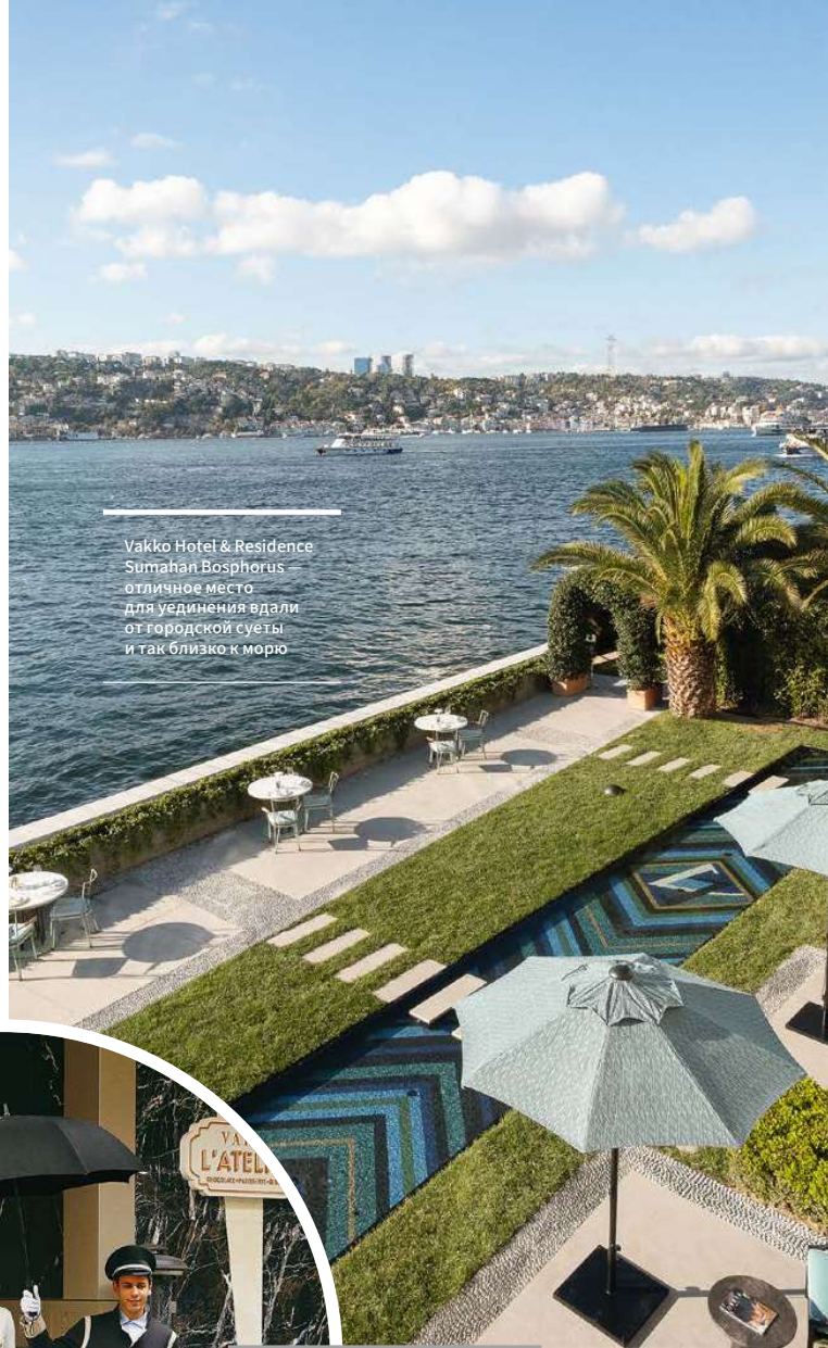
Vakko Hotel & Residence Sumahan Bosphorus отличное место для уединения вдали от городской суеты и так близко к морю