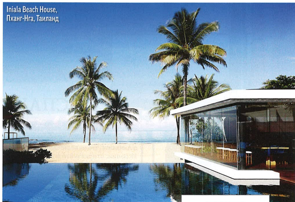
Iniala Beach House, Пханг-Нга, Таиланд