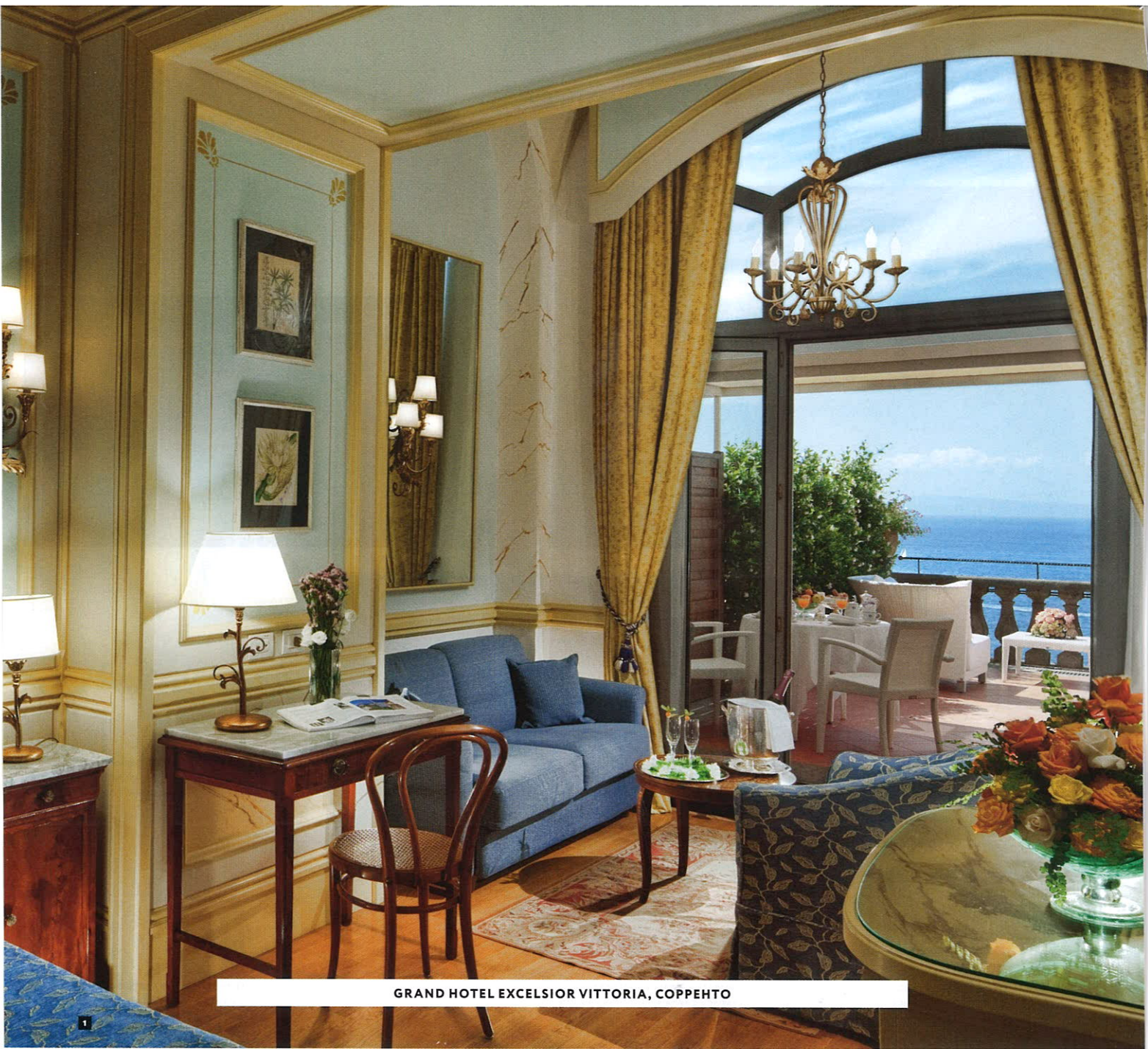
GRAND HOTEL EXCELSIOR VITTORIA, COPPENTO

1 В ОТЕЛЕ НЕТ ОДИНАКОВЫХ НОМЕРОВ – РОДНИТ ИХ РАЗВЕ ТОЛЬКО ВИД НА НЕАПОЛИТАНСКИЙ ЗАЛИВ И ВЕЗУВИЙ С ТЕРРАСЫ ИЛИ БАЛКОНА.