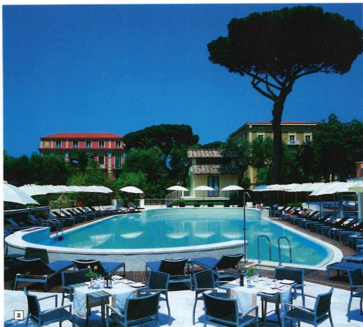
3 ВОКРУГ EXCELSIOR VITTORIA ПРЕКРАСНЫЙ ПАРК ПЛОЩАДЬЮ БОЛЕЕ ДВУХ ГЕКТАРОВ.