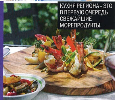
КУХНЯ РЕГИОНА – ЭТО В ПЕРВУЮ ОЧЕРЕДЬ СВЕЖАЙШИЕ МОРЕПРОДУКТЫ.

Легендарный отель du Cap Eden-Roc. Пообедай на террасе!