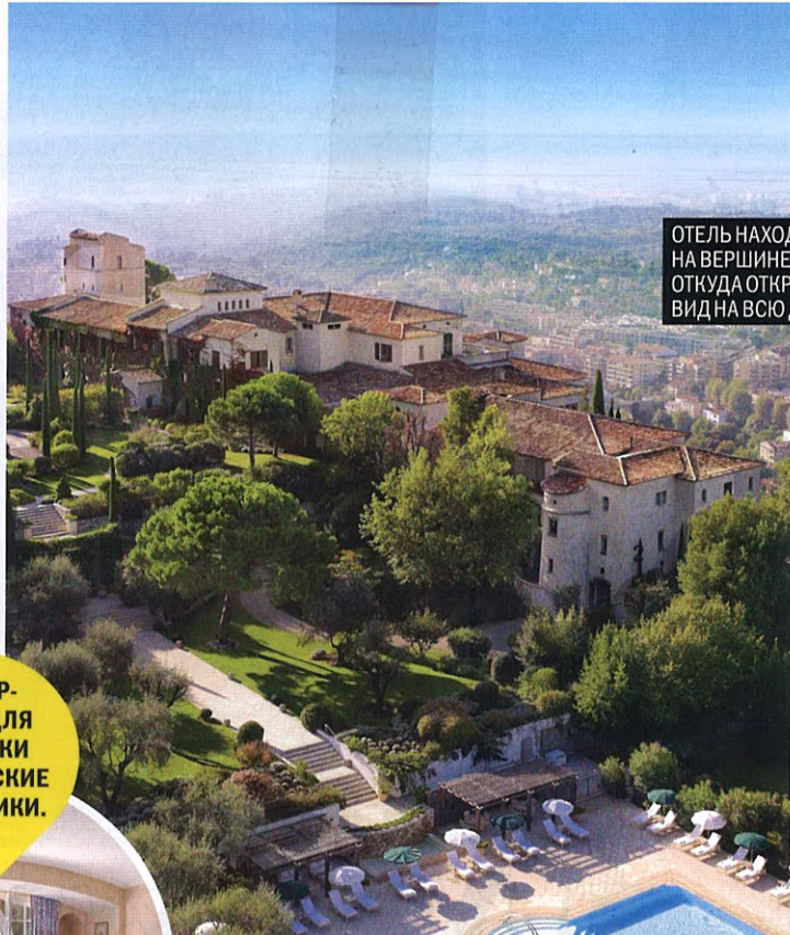
ОТЕЛЬ НАХОДИТСЯ НА ВЕРШИНЕ ХОЛМА, ОТКУДА ОТКРЫВАЕТСЯ ВИД НА ВСЮ ДОЛИНУ.

В интерьере знаменитый прованский стиль сочетается с современной роскошью: ткани Etro в мебелировке, на полках – китайский фарфор, в ванной – розовый мрамор. Особая гордость отеля – спа-центр, в котором используют косметику La Prairie.