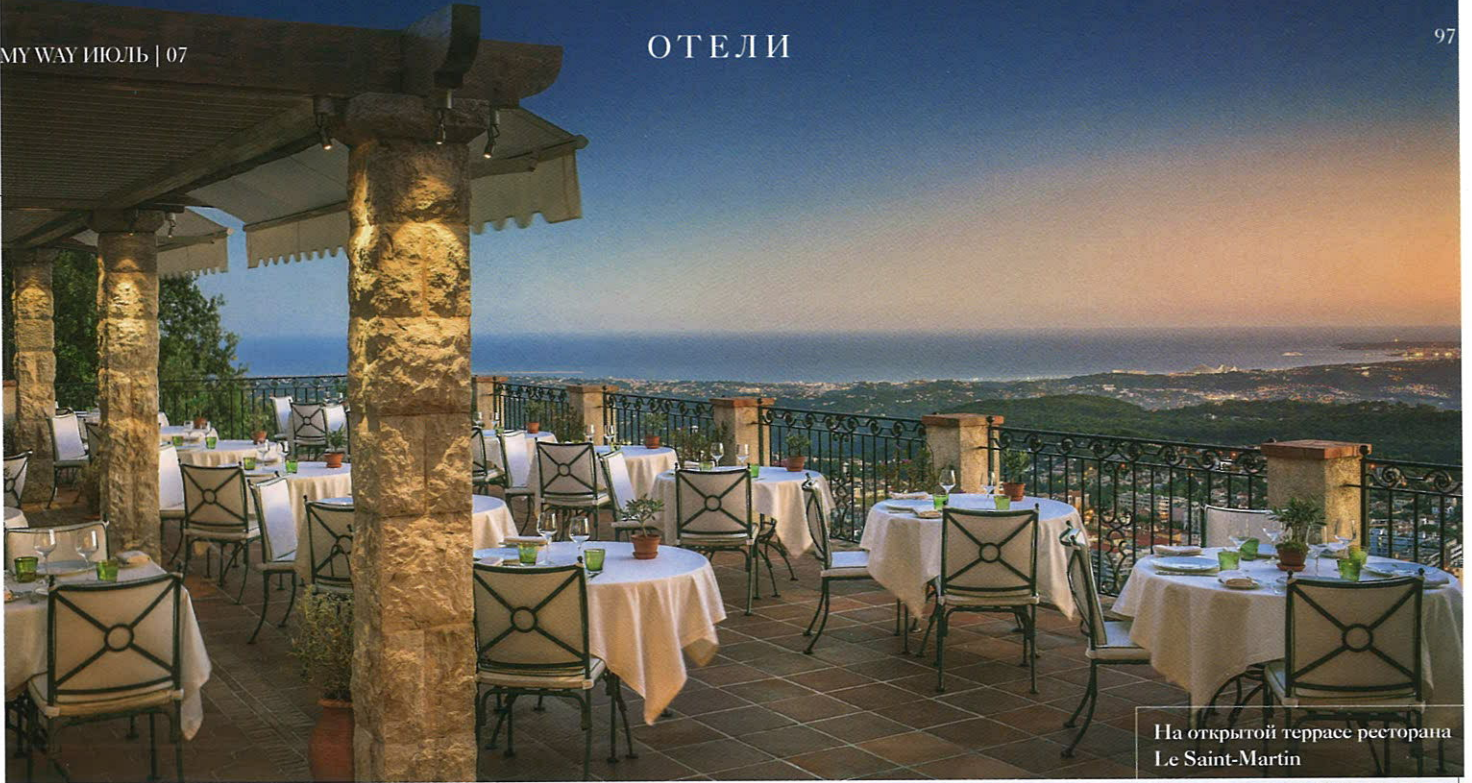
На открытой террасе ресторана Le Saint-Martin