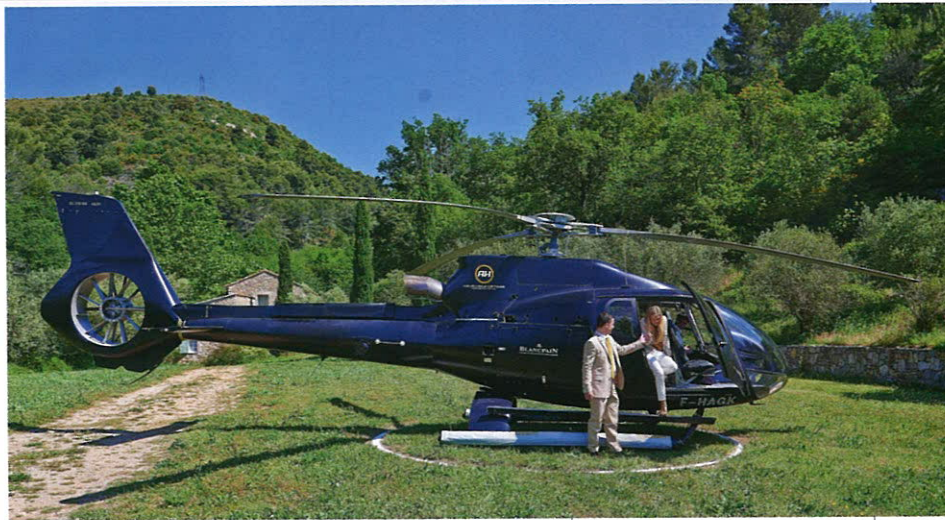
Château Saint-Martin & Spa находится в 15 км от аэропорта Ниццы

Чтобы привести себя в порядок перед ужином, достаточно отдалиться в руки супер-профессионалов Spa Saint-Martin by La