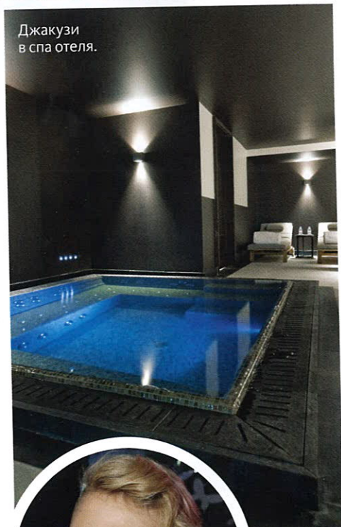
Джакузи в спа отеля.