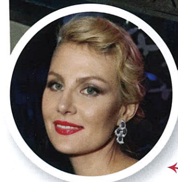
С момента своего открытия в 2013 году отель постоянно принимает звездных гостей. Среди них была замечена и Рената Литвинова.