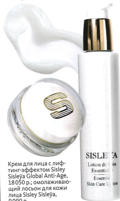
Крем для лица с лифтинг-эффектом Sisley Sisleya Global Anti-Age, 18050 р.; омолаживающий лосьон для кожи лица Sisley Sisleya, 9090 р.

Sisley известна своими разработками в области фитокосметологии и славится омолаживающими средствами с экстрактами растений. Линия Sisleya — это настоящее ноу-хау марки, и именно на ней работают в здешнем спа. Целебные свойства трав и эфирных масел и особые техники нанесения кремов делают Sisley одним из лидеров мирового рынка anti-age-средств.