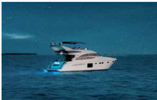
Круизная яхта отеля; общий вид курорта The Nautilus; интерьер виллы Beach Residence