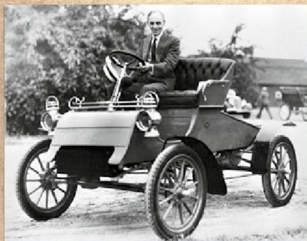
↑ Генри Форд

→ Архивная открытка, отправленная из отеля в 1941 году