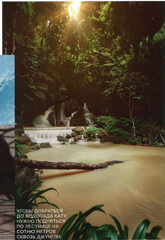
ЧТОБЫ ДОБРАТЬСЯ ДО ВОДОПАДА КАТУ, НУЖНО ПОДНЯТЬСЯ ПО ЛЕСТНИЦЕ НА СОТНЮ МЕТРОВ СКВОЗЬ ДЖУНГЛИ.