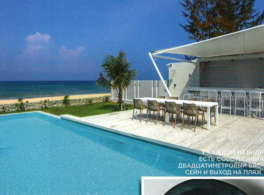
У КАЖДОЙ ИЗ ВИЛЛ ЕСТЬ СОБСТВЕННЫЙ ДВАДЦАТИМЕТРОВЫЙ БАС- СЕЙН И ВЫХОД НА ПЛЯЖ.