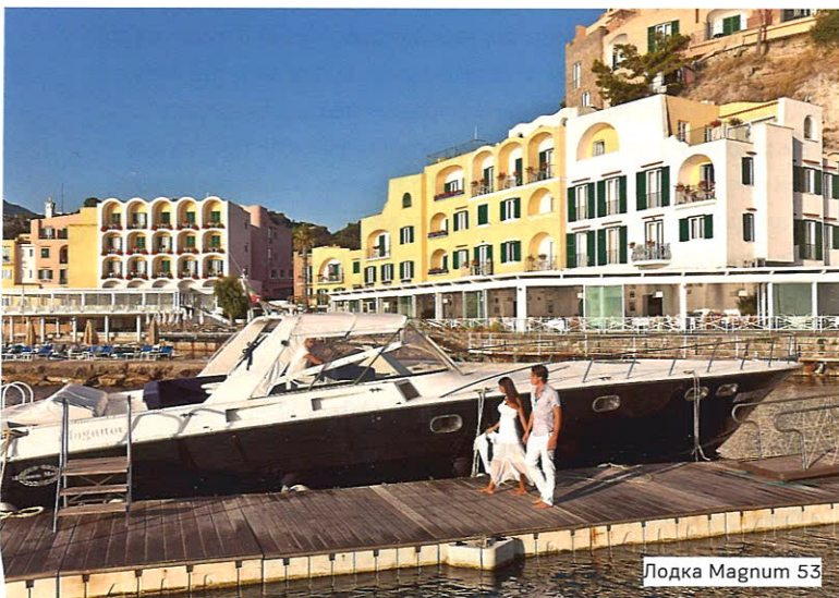
Лодка Magnum 53