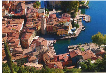
РИВА-ДЕЛЬ-ГАРДА С ВЫСОТЫ ПТИЧЬЕГО ПОЛЕТА