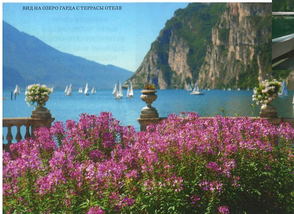
ВИД НА ОЗЕРО ГАРДА С ТЕРРАСЫ ОТЕЛЯ