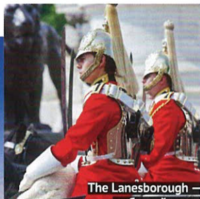
The Lanesborough — любимый отель королевской семьи