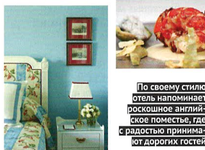
По своему стилю отель напоминает роскошное английское поместье, где с радостью принимают дорогих гостей

площадью более 1600 кв. м. Разнообразные массажи и специальные процедуры позволяют достичь гармонии и релакса. Постояльцев отеля ждут занятия по фитнесу, йоге, индивидуальные тренировки и даже уроки танцев. В восточной части спа еще один приятный бонус — зона с гидробассейном. Кстати, здесь считают, что через желудок лежит путь к сердцу не только мужчины, — каждой посетительнице предложат специальное здоровое меню, куда входят маринованный желтохвостый тунец, гаспачо из ананаса, тартар из помидоров. В общем, готовься получить свою порцию королевского удовольствия.