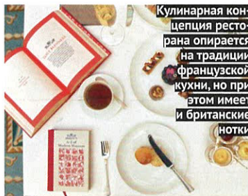
Кулинарная концепция ресторана опирается на традиции французской кухни, но при этом имеет и британские нотки

В марте этого года в отеле распахнул свои двери спа-центр