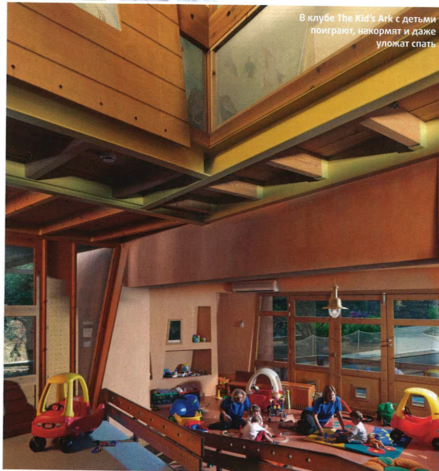
В клубе The Kid's Ark с детьми поиграют, накормят и даже уложат спать