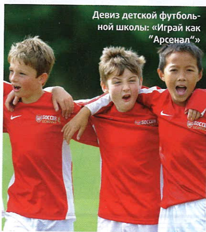
Девиз детской футбольной школы: «Играй как "Арсенал"»