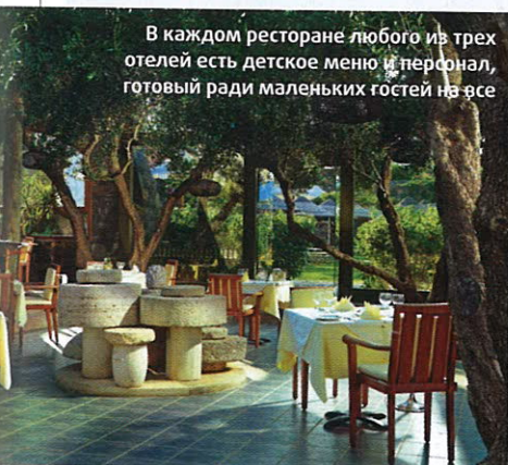
В каждом ресторане любого из трех отелей есть детское меню и персонал, готовый ради маленьких гостей на все