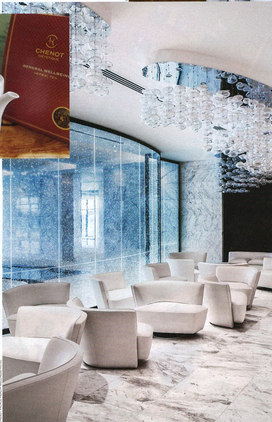
CHENOT PALACE HEALTH WELLNESS HOTEL

В новый Chenot Palace Gabala из Баку ехать около трех часов. Когда я об этом услышала, чуть было не отказалась от поездки. Сначала три часа лететь, а потом еще столько же трястись по не самым лучшим кавказским дорогам? Но любовь к Азербайджану и любопытство перевесили сомнения, и впоследствии я ни секунды не пожалела об этих неожиданно случившихся «азербайджанских каникулах».