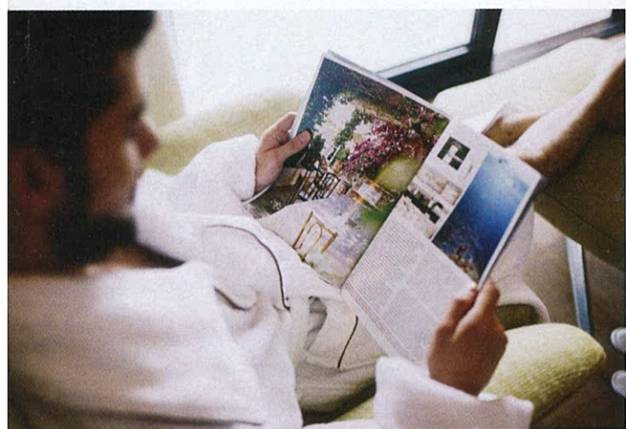
CHENOT PALACE HEALTH WELLNESS HOTEL