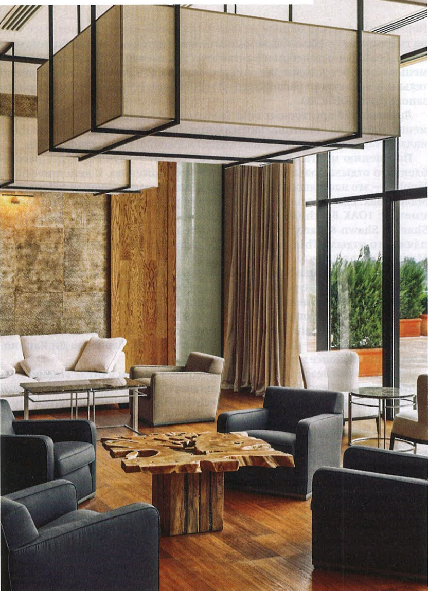
CHENOT PALACE HEALTH WELLNESS HOTEL