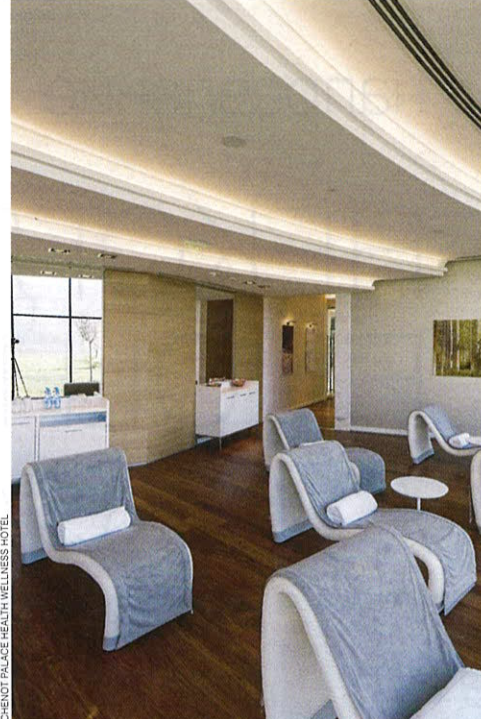
CHENOT PALACE HEALTH WELLNESS HOTEL