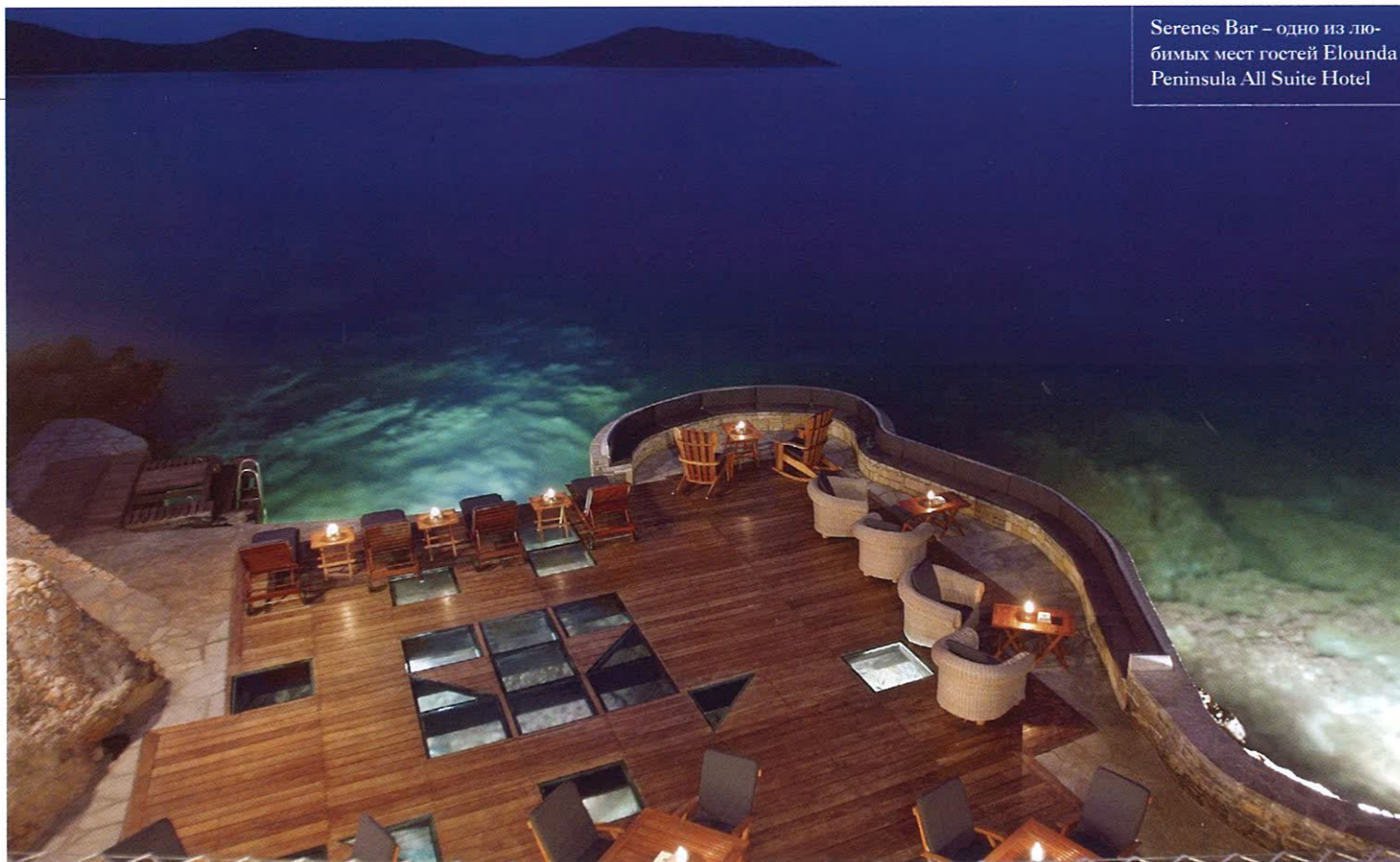
Serenes Bar – одно из любимых мест гостей Elounda Peninsula All Suite Hotel

Некоторые из них, к слову, шутливо жалуются: находиться в сютах Elounda Peninsula All Suite Hotel – такое удовольствие, что любая попытка покинуть номер требует определенного усилия воли. Если вы тоже столкнетесь с этой «неприятностью», поверьте: ваш подвиг будет достойно вознагражден. Тем, например, у кого подрастает звезда футбола, первым делом стоит отправиться на разведку в детскую футбольную школу клуба «Валенсия», созданную специально для юных гостей отелей Elounda Peninsula, Elounda Mare и Porto Elounda. С детьми тут занимаются опытные наставники из Global Premier Soccer – одной из самых крупных и успешных футбольных организаций в мире, тесно работающей с такими известными командами, как «Бавария» и «Валенсия». Под чутким руководством профессиональных тренеров ребята в возрасте от 3 до 16 лет знакомятся с основами игровой техники, узнают, что такое контроль мяча или обводка соперника, пробуют себя на разных позициях, узнают, когда нужно сделать пас, а когда самому отправить мяч в ворота. Словом, занимаются делом, которое приносит им настоящую радость и, возможно, станет для них первым серьезным шагом в мир профессионального спорта.