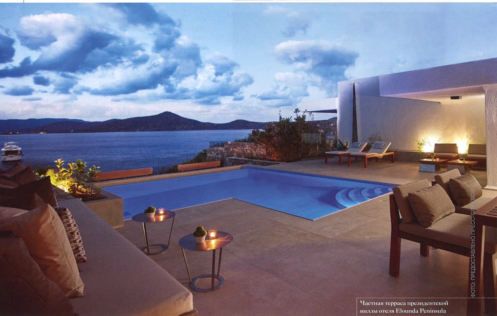
Частная терраса президентской виллы отеля Elounda Peninsula