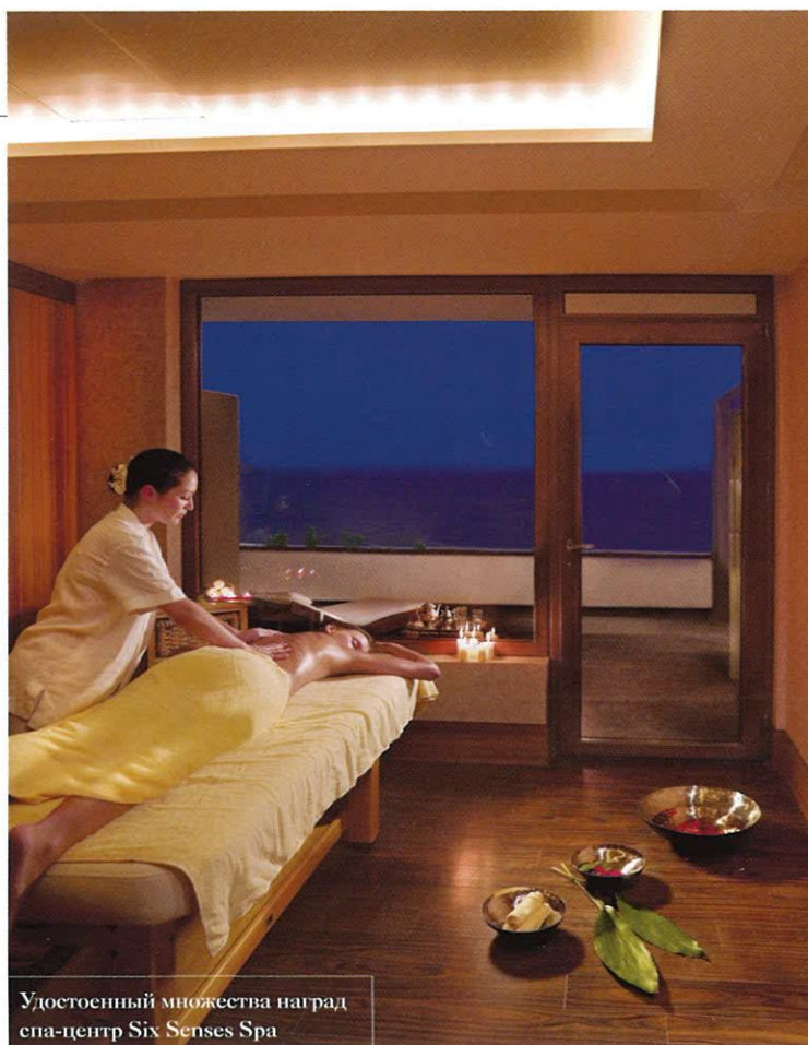
Удостоенный множества наград спа-центр Six Senses Spa

Благодаря кристально чистой воде, мягким песчаным отмелям и отсутствию волн пляж Elounda Peninsula All Suite Hotel справедливо считается одним из лучших на Крите. Но в этом году семья Кокотос, заручившись поддержкой британских дизайнеров из бюро WATG, решила сделать его еще более привлекательным. Как, спросите вы? Отвечаем: построив самый большой прибрежный бассейн на всем острове. На самом деле их даже два – главный площадью 420 м 2 и детский площадью 80 м 2 . Удобные лежаки, широкие ступени для комфортного входа, возможность подогрева воды и гидромассажная зона вместе с богатой растительностью, современным решением затенения и приватности, удобными дорожками и ярким ночным освещением призваны удовлетворить требования самых взыскательных гостей.