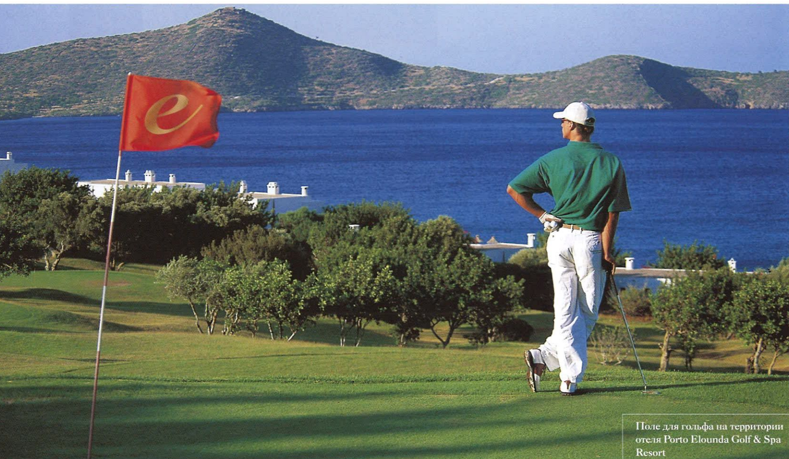
Поле для гольфа на территории отеля Porto Elounda Golf & Spa Resort