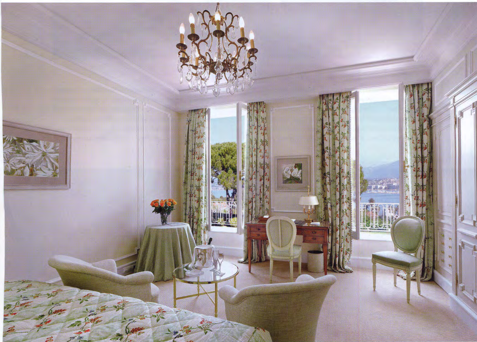
Персонал Hôtel du Cap-Eden-Roc исповедует принцип, заданный Андре Селла: безупречность в каждой детали и стремление к совершенству