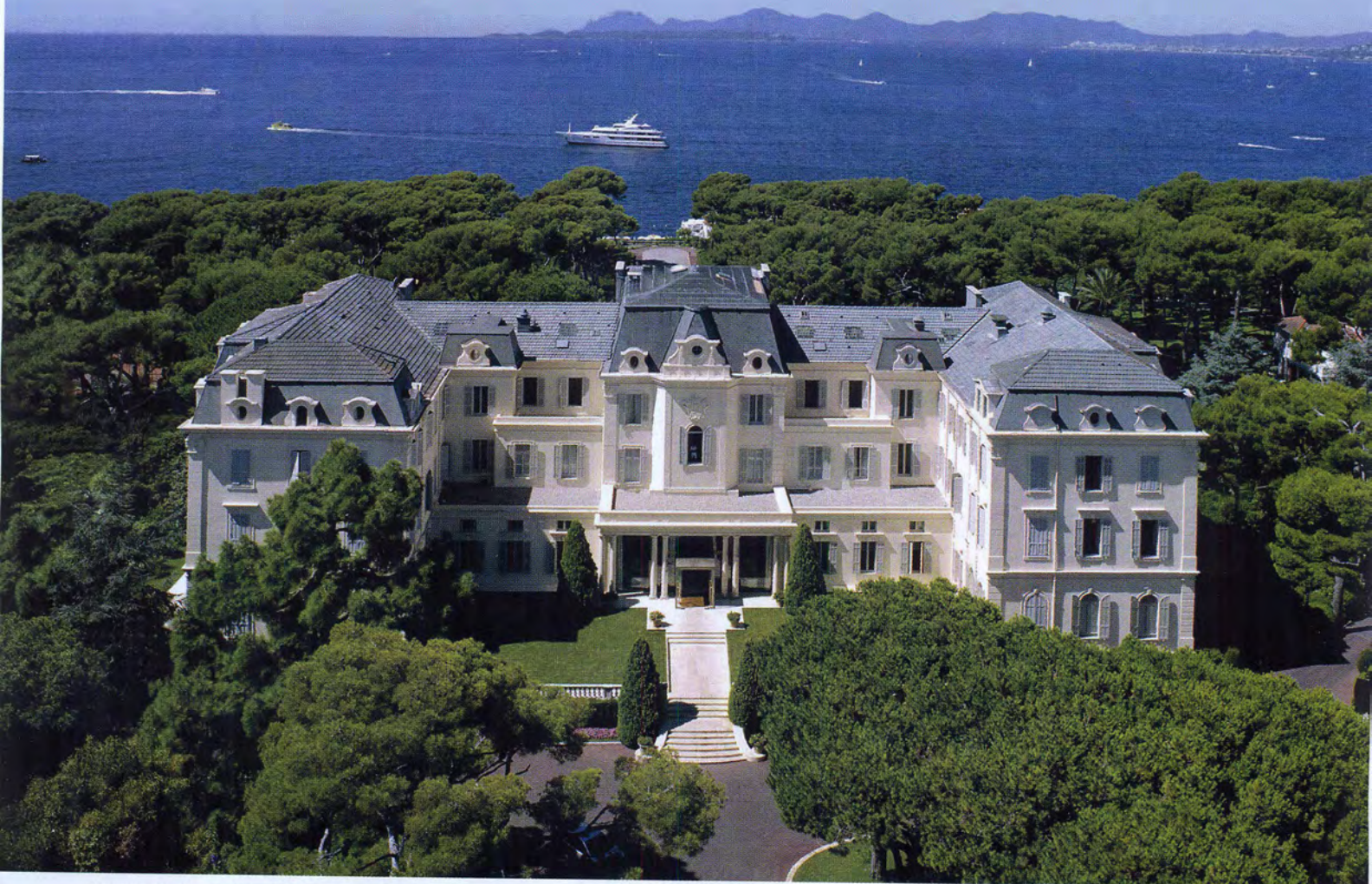
Расположенный между Каннами и Ниццей отель словно магнит влечет звезд мирового кино, которые останавливаются только здесь