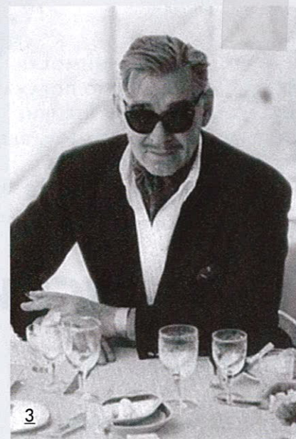
1. Сьют с видом на море. 2. Элизабет Тейлор во время съемок «Клеопатры» в 1962 году приплыла на Искью. 3. Кларк Гейбл на террасе отеля Regina Isabella. 4. Единственный частный пляж на острове располагается в бухте отеля.