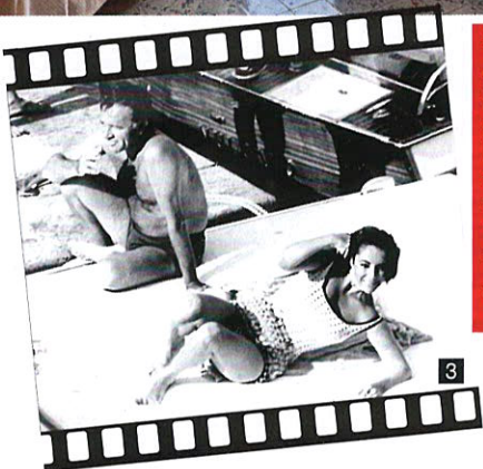
1. Сюит в отеле L'Albergo della Regina Isabella. 2. Вместо обычного пляжа у «Королевы Изабеллы» пирс с лежаками. 3. Актеры Элизабет Тейлор и Ричард Бартон на Искье в период их страстного романа, 1962.