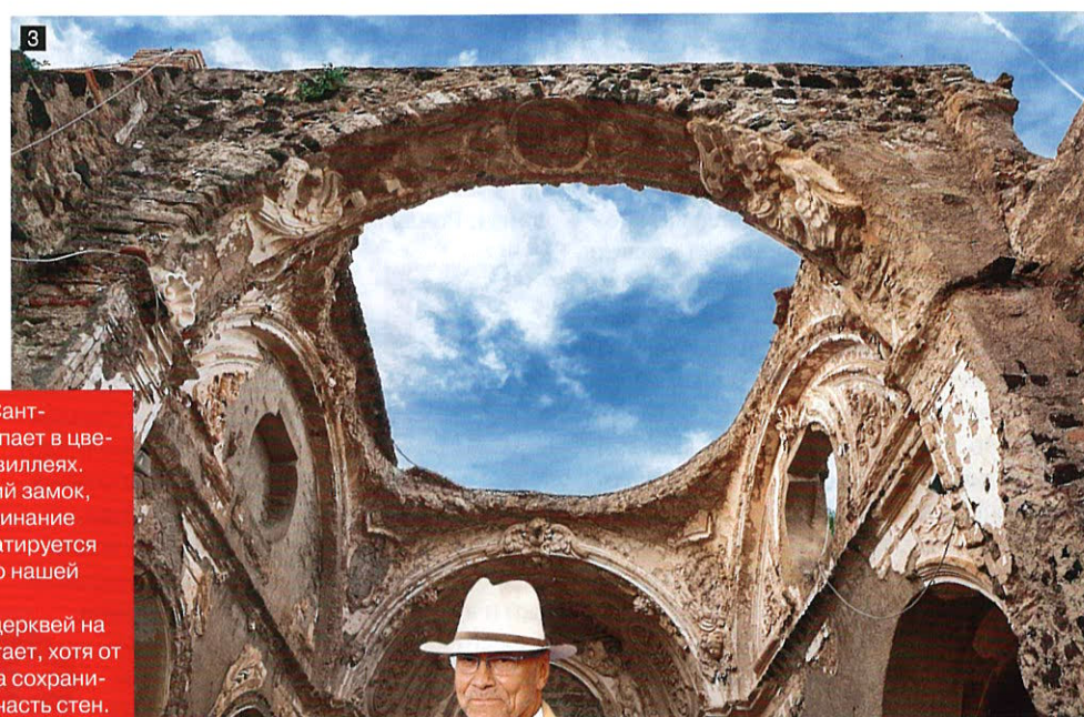
1. Деревня Сант-Анджело утопает в цветущих бугенвиллеях. 2. Арагонский замок, первое упоминание о котором датируется 474 годом до нашей эры. 3. Древних церквей на острове хватает, хотя от большинства сохранилась только часть стен.