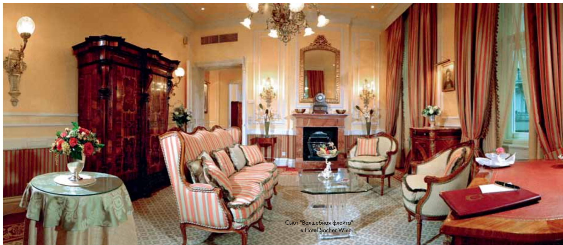
Сьют "Волшебная флейта" в Hotel Sacher Wien.

Венский Sacher по праву может считаться одним из самых престижных и стильных отелей Европы