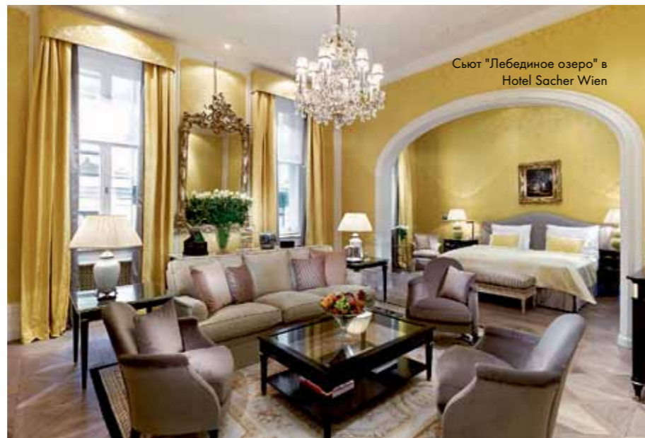
Сьют "Лебединое озеро" в Hotel Sacher Wien