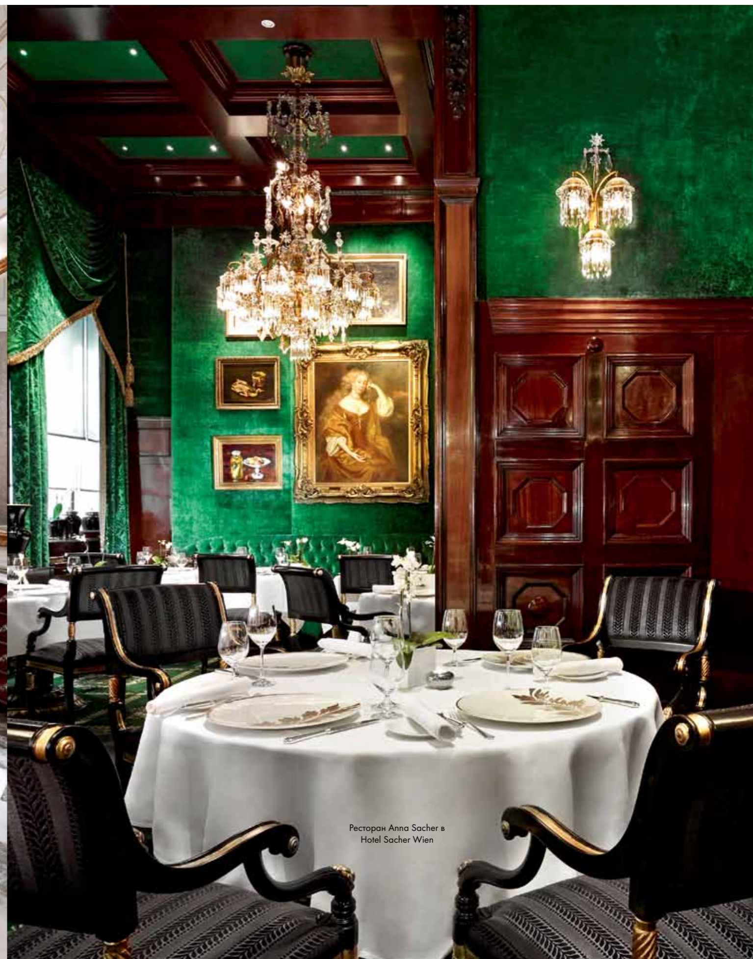
Ресторан Anna Sacher в Hotel Sacher Wien