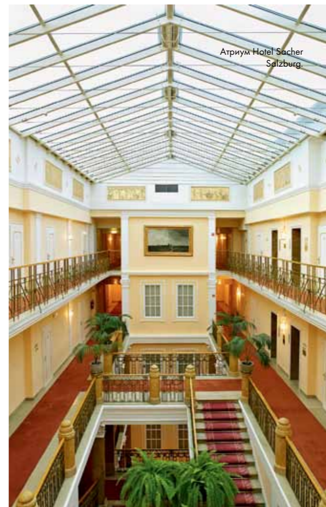
Атриум Hotel Sacher Salzburg.

В конце XIX – начале XX века отель Sacher стал излюбленным местом венской богемы и золотой молодежи. Молодые аристократы и наследники промышленных империй закатывали здесь грандиозные вечеринки. Все, что там происходило, хранилось в тайне – неслучайно в вестибюле отеля стоит мраморный купидон с лукавой улыбкой на лице и пальцем, прижатым к губам, – но легенды об этих светских мероприятиях в Вене вспоминают до сих пор. Рассказывают, например, как эрцгерцог Отто как-то спустился к завтраку в слегка туманном состоянии после затянувшейся вечеринки, при этом из предметов гардероба на нем в тот момент были лишь пояс со шпагой