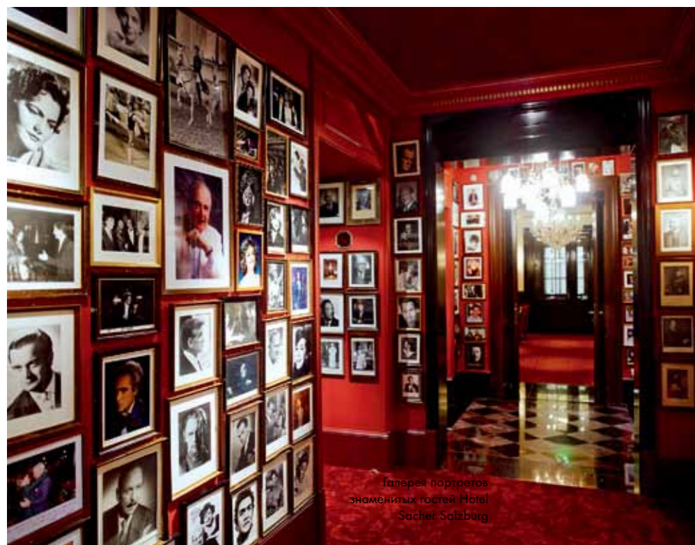
Галерея портретов знаменитых гостей Hotel Sacher Salzburg