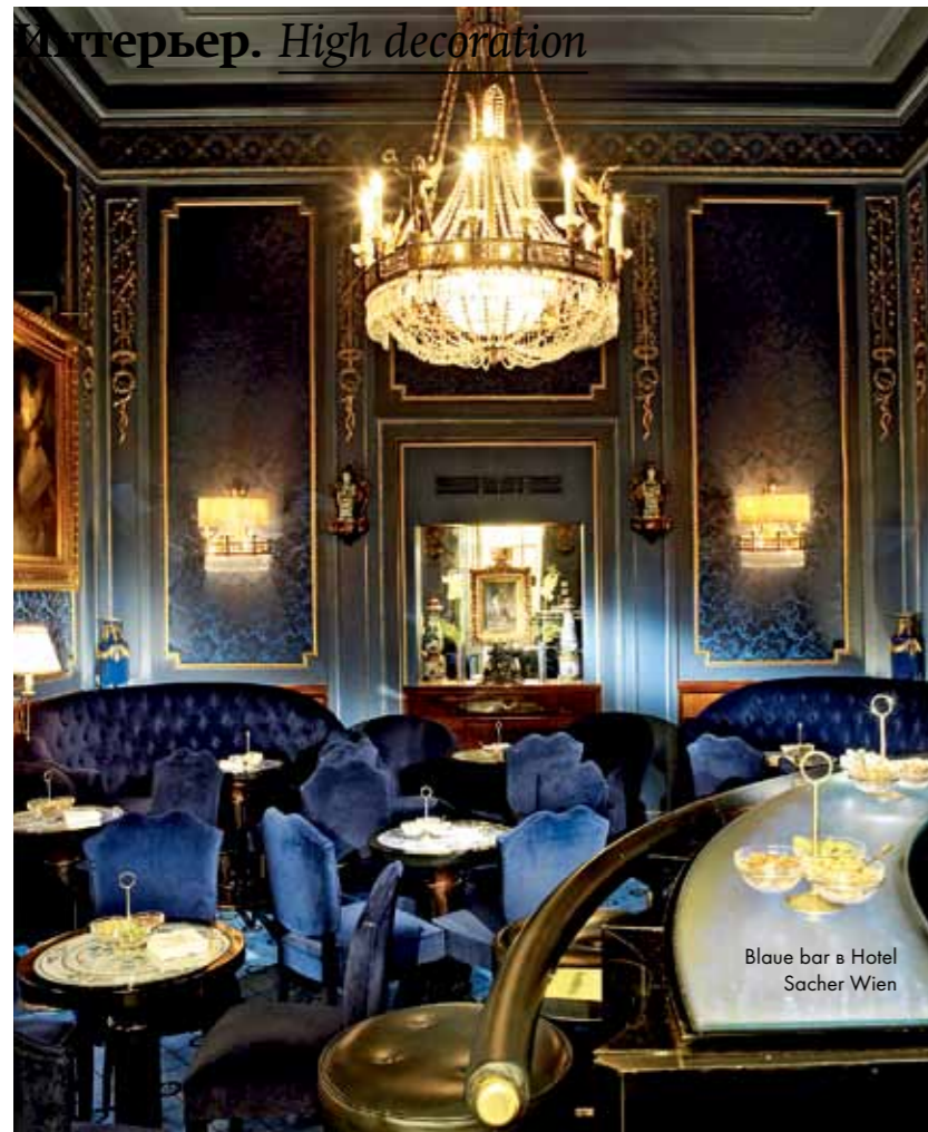
Blue bar в Hotel Sacher Wien