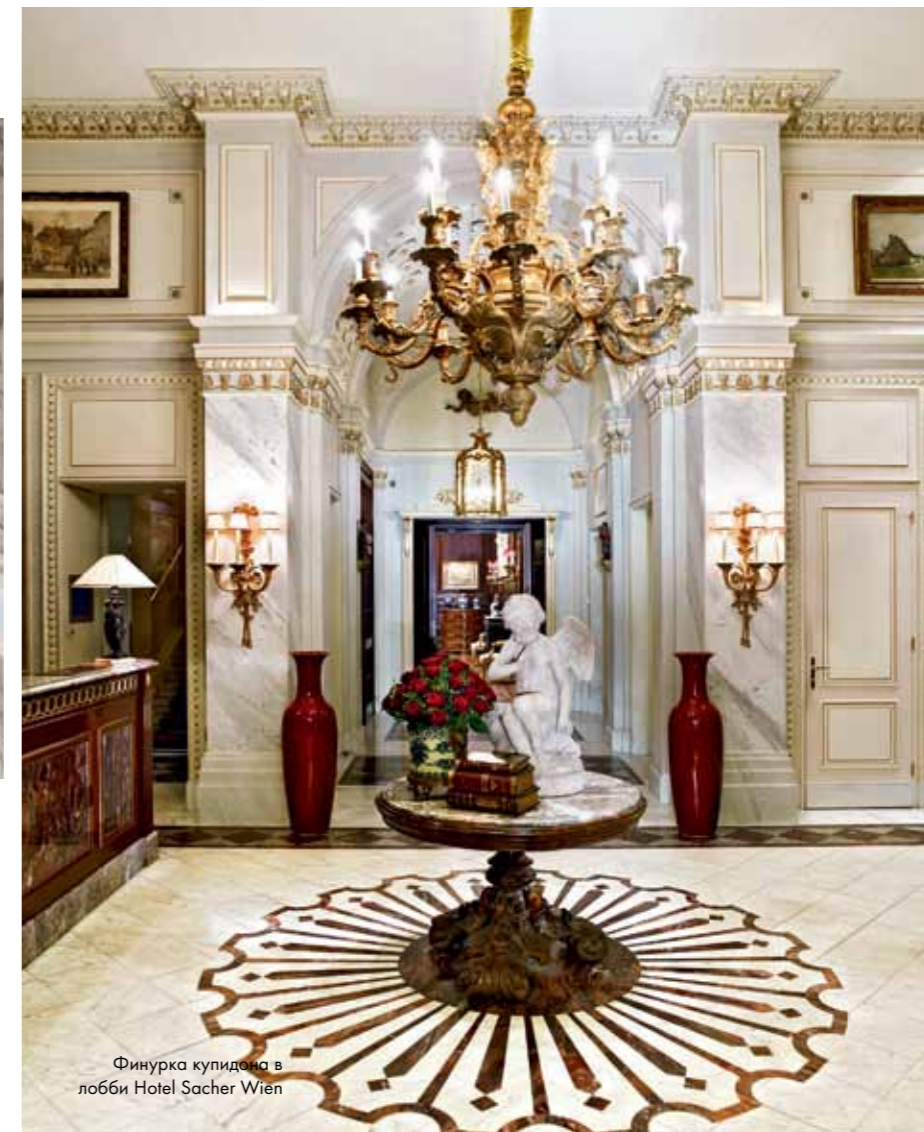
Финурка купидона в лобби Hotel Sacher Wien

Венский Sacher по праву может считаться одним из самых престижных и стильных отелей Европы