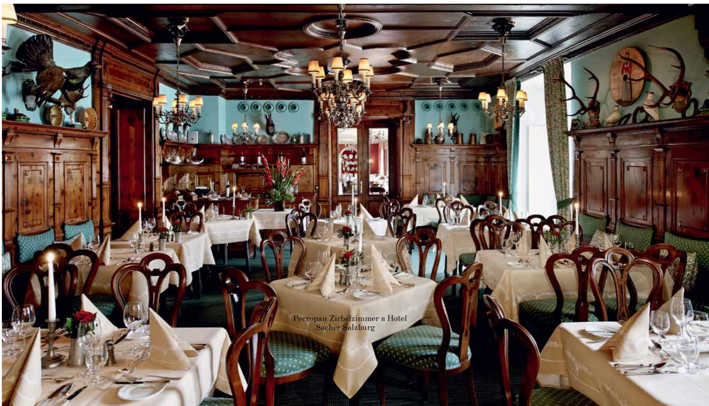
Ресторан Zirbelzimmer в Hotel Sacher Salzburg

ную и гардеробную. Чтобы сохранить атмосферу старины, в номерах наряду с современной мебелью сохранили два или три антикварных интерьерных предмета. Захеры и Гюртлеры в течение полутора веков собирали коллекцию живописи XIX века. Сейчас эти картины украшают номера и общественные зоны отелей. Предмет особой гордости отелей Sacher Wien и Sacher Salzburg – галереи портретов известных людей, которые в разное время останавливались в их номерах. Комнаты оборудованы современной техникой и электроникой, но контраст со старинным декором не режет глаз: все нововведения тщательно замаскированы. Например, открыв антикварный буфет, можно обнаружить там огромную плазменную TV-панель и медиа-центр.