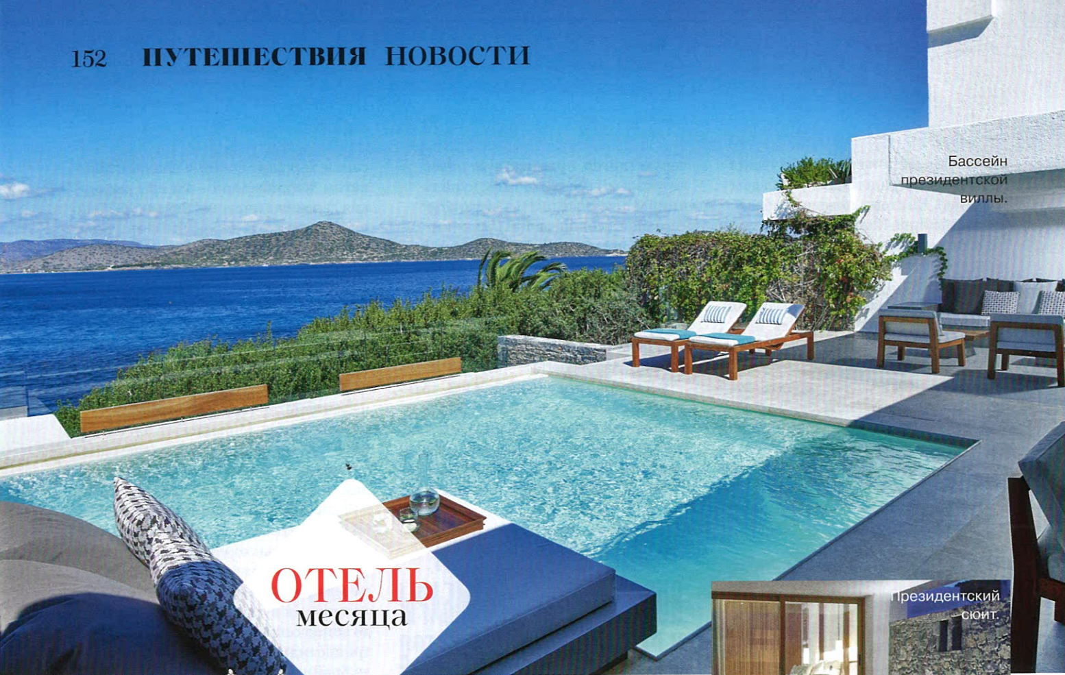
Бассейн президентской виллы.