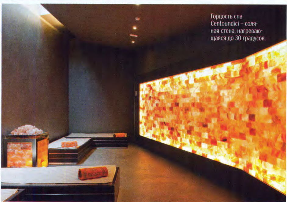
Гордость спа Centoundici – соляная стена, нагревающаяся до 30 градусов.

дой Мишлен Mirabelle в Риме. В винном погребе The Galley, кроме богатой коллекции итальянских и европейских вин, главная гордость – это сухое Trentino DOC и десертное Vino Santo, сделанные из редкого сорта белого винограда «нозиола». На Vino Santo («Святое вино») в регионе озера Гарды молятся все местные, его производят здесь (и только здесь) уже сотни лет. Святым его называют, потому что отжим из винограда производят в Страстную неделю, – хотя любой местный винодел вам скажет, что название произошло от того, что процесс требует терпения святого мученика (итальянцы любят преувеличивать). Но для него действительно нужны только самые хорошие грозди, которые перебирают вручную, после чего сушат в ящиках, и потом еще три-четыре года вино ждет своего часа в дубовых бочках. Увидеть собственными глазами, каких усилий (а потому и денег) стоит Vino Santo, можно на винодельнях, их в округе множество. Самая знаменитая – Tenuta San Leonardo, которая с 18 века принадлежит маркизам Герьеры Гонзага.