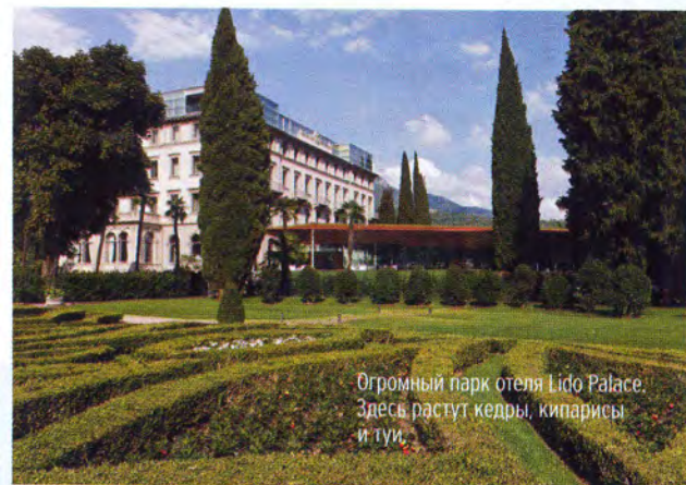
Огромный парк отеля Lido Palace. Здесь растут кедры, кипарисы и туи.