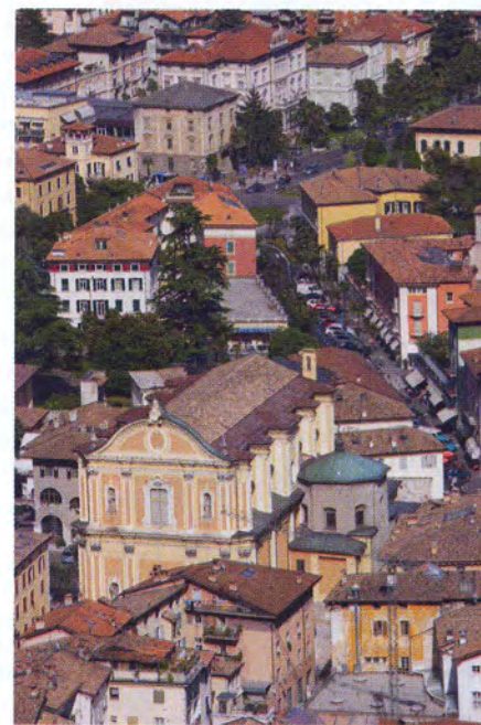
Вид на город Тренто.

Если захочется путешествовать, из Lido Palace легко и быстро можно добраться до самых живописных городов округа – в частности, до средневекового Тренто или до Роверето, где находится один из крупнейших в Европе музеев современного искусства MART: Il Museo d'Arte Moderna e Contemporanea di Trento e Rovereto ( www.mart.trento.it ). Но, в принципе, далеко от озера уезжать нет смысла – даже не выходя из Lido Palace, в полной мере понимаешь, почему озеро Гарда было любимым местом отдыха Фридриха Ницше, Томаса Манна, Эриха Марии Рильке, Иоганна Вольфганга фон Гёте и самой влиятельной монаршей династии Европы – Габсбургов.