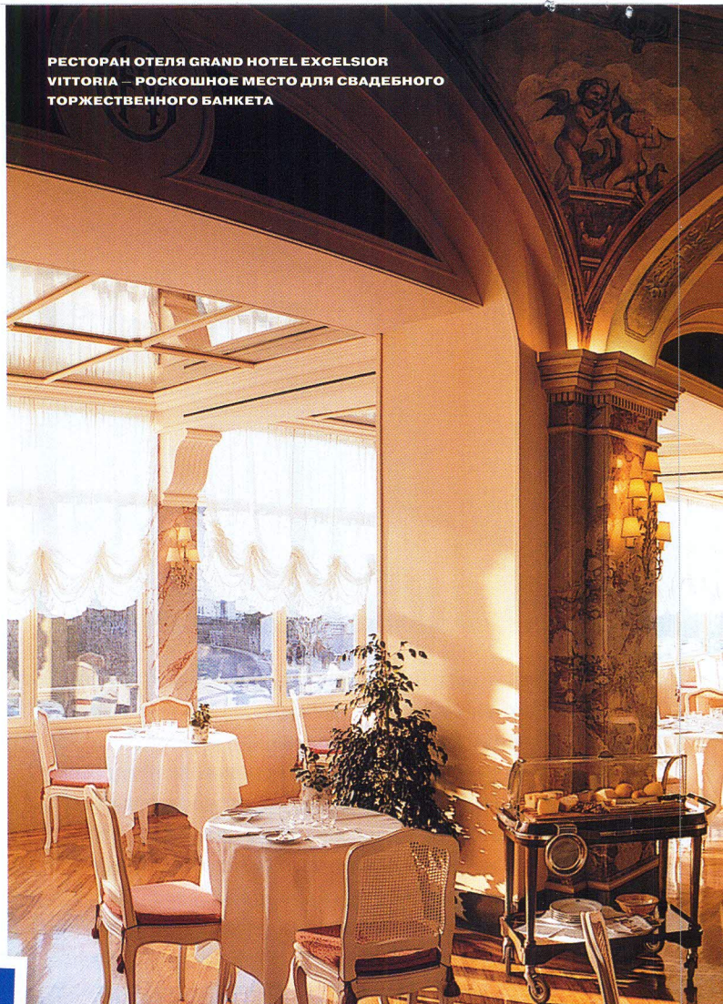
РЕСТОРАН ОТЕЛЯ GRAND HOTEL EXCELSIOR VITTORIA — РОСКОШНОЕ МЕСТО ДЛЯ СВАДЕБНОГО ТОРЖЕСТВЕННОГО БАНКЕТА

Следуя примеру Лучано Паваротти, Софи Лорен и британской принцессы Маргарет, остановиться можно в старейшем отеле Сорренто Grand Hotel Excelsior Vittoria, который в этом году отмечает свое 178-летие (!). Здания расположены на высоком утесе прямо над портом города, и, чтобы оказаться на пляже или сесть на катер, достаточно лишь спуститься вниз на специальном лифте. Не раз отель был признан лучшим в Европе, и не зря: его роскошные номера отделаны каждый в своем уникальном стиле. Лаконичный европейский дизайн, расписанные библейскими картинами потолки, позолота или классические итальянские беленые арки — даже звездным гостям непросто выбрать один из