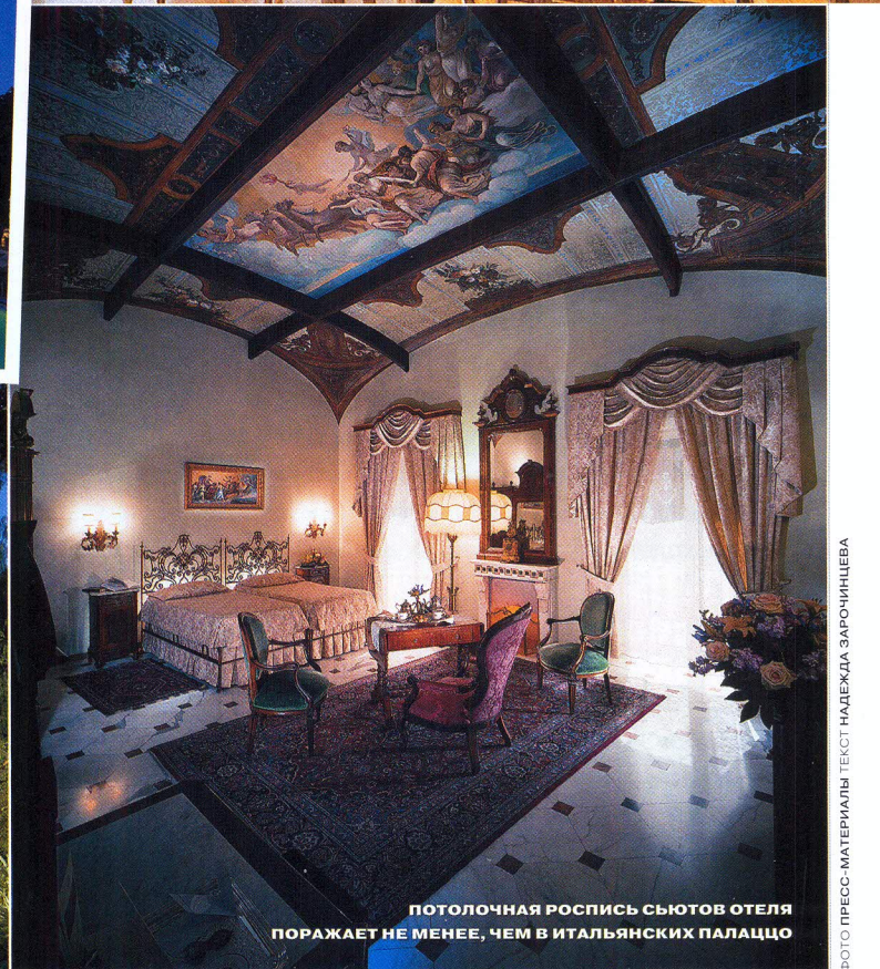
ПОТОЛОЧНАЯ РОСПИСЬ СЬЮТОВ ОТЕЛЯ ПОРАЖАЕТ НЕ МЕНЕЕ, ЧЕМ В ИТАЛЬЯНСКИХ ПАЛАЦЦО