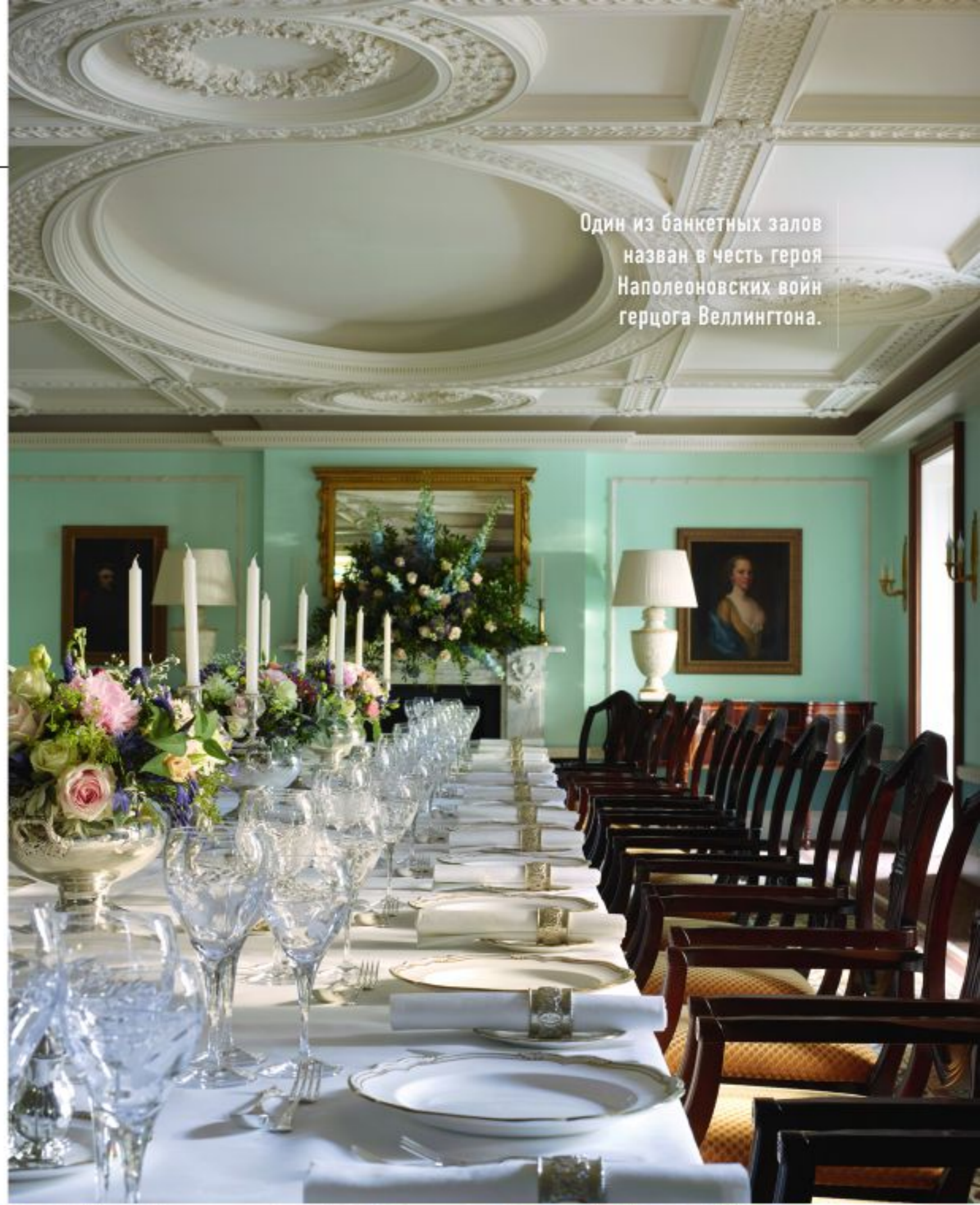
Один из банкетных залов назван в честь героя Наполеоновских войн герцога Веллингтона.