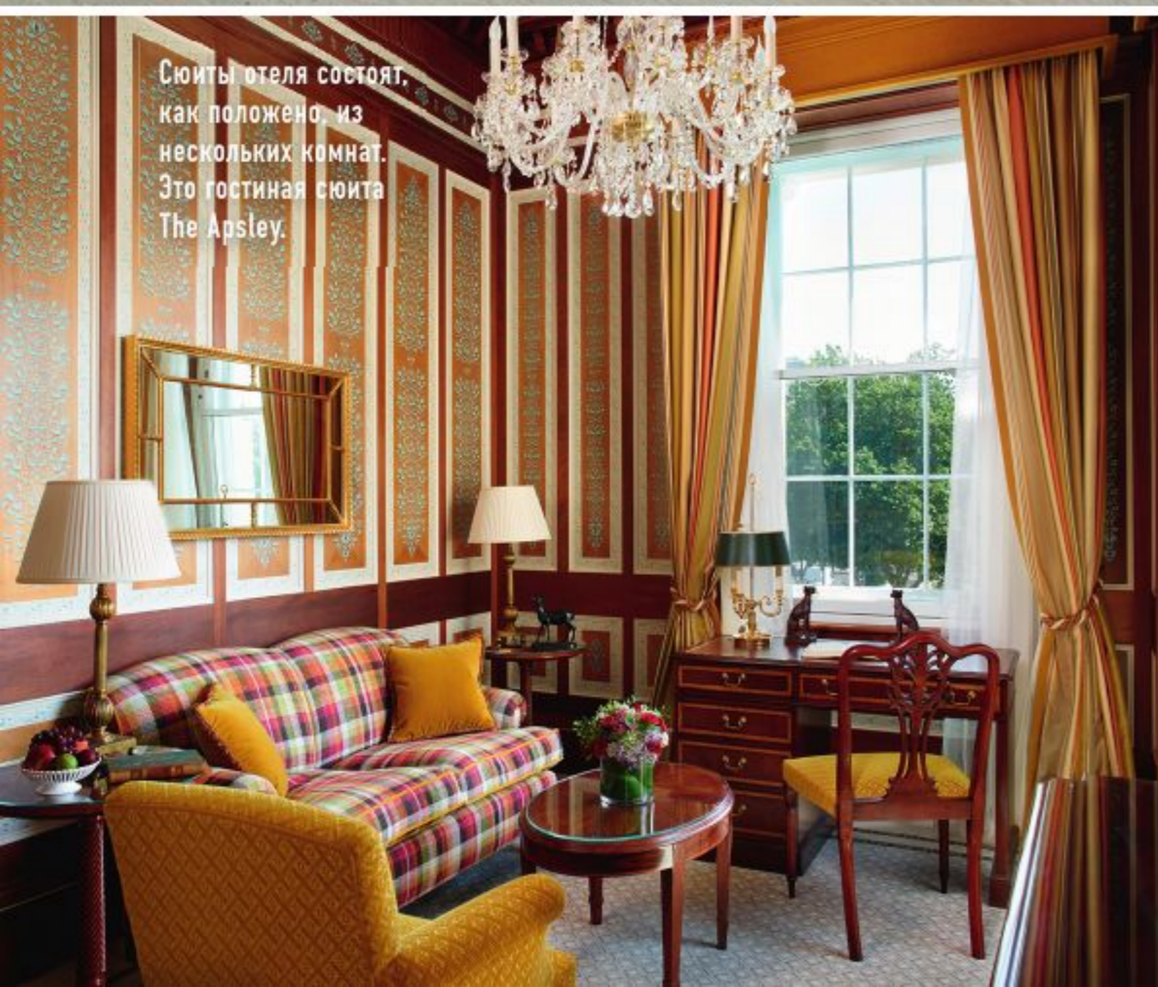
Сюиты отеля состоят, как положено, из нескольких комнат. Это гостиная сюита The Apsley.

> постройки. А внутри — как подлинный аристократический особняк с долгой историей. В интерьерах старинных домов не бывает стилистического единства, не гнались за ним и в The Lanesborough. Все общественные зоны (библиотека, сигарная, рестораны и салоны) и номера выглядят жилыми комнатами, оформленными классически, но с разнообразием и смешением эпох, которое в настоящем доме возникает само собой с течением времени, а в отеле было тщательно воссоздано командой великого покойного декоратора Альберто Пинто. Две тысячи часов ручной росписи стен и потолков, три миллиона стежков на шторах и подушках, двадцать три персональных дворцовых — все это, конечно, производит впечатление. Но не столь сильное, как возможность встать утром, сесть завтракать у окна с видом на Букингемский дворец и почувствовать себя гостем в доме настоящего английского аристократа.