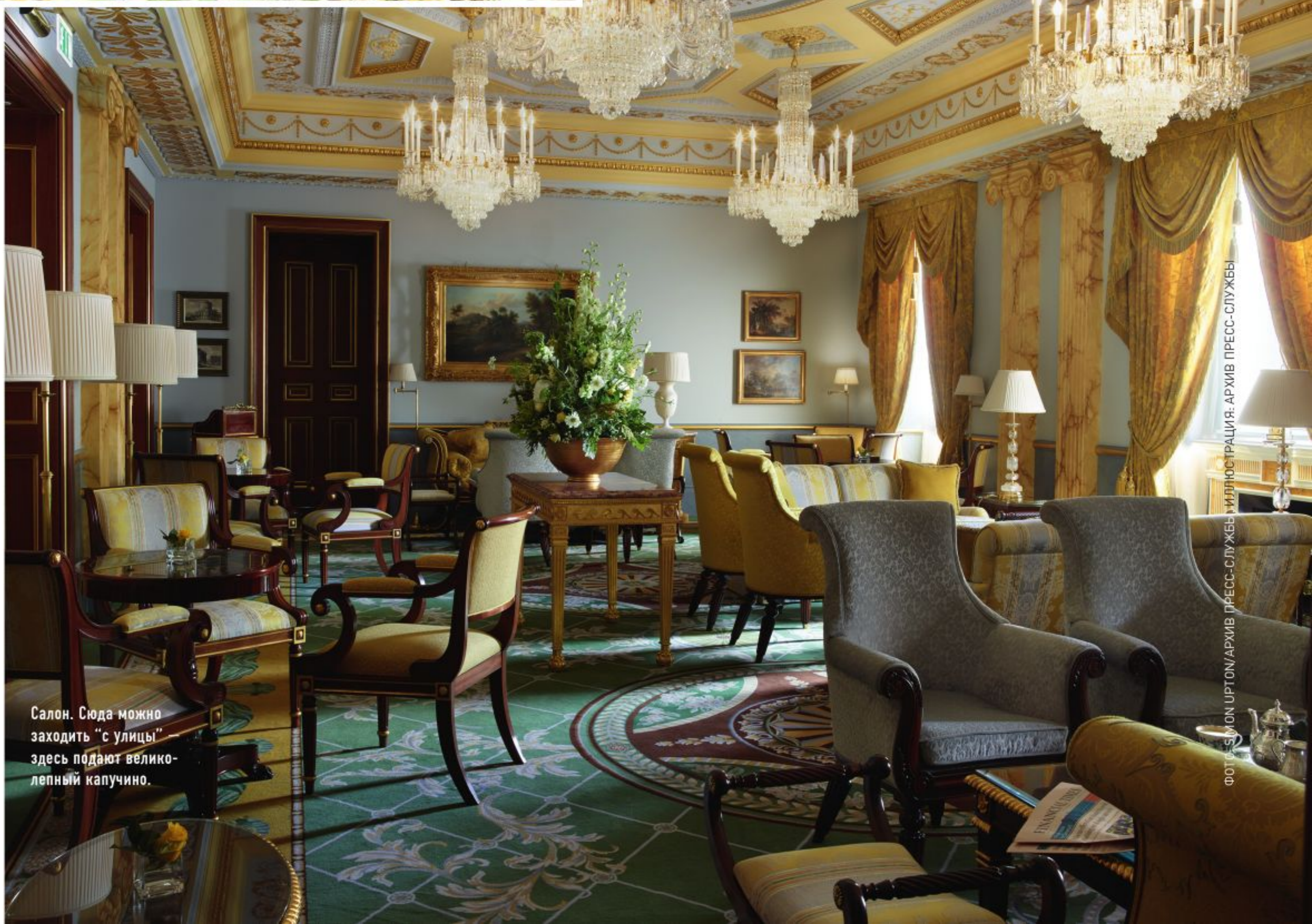
Салон. Сюда можно заходить "с улицы" здесь подают велико- лепный капучино.