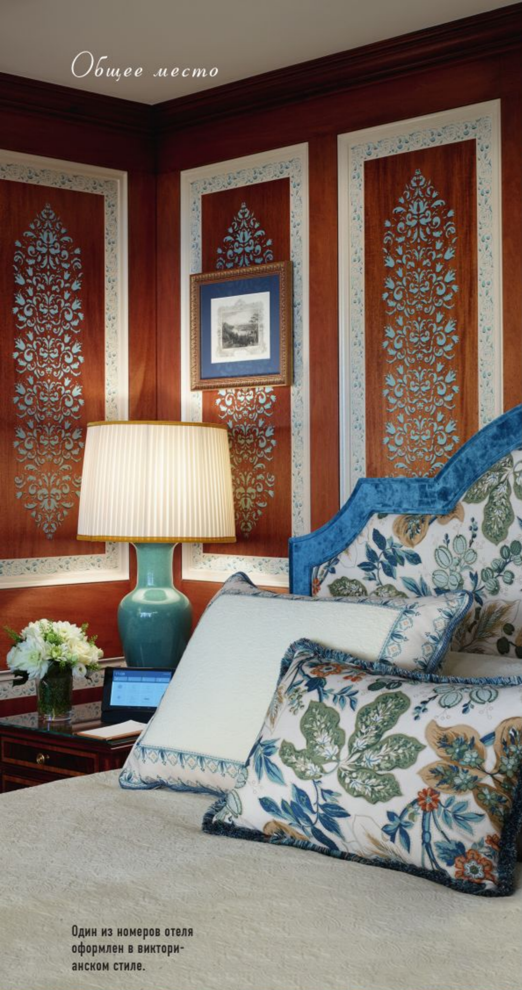
Один из номеров отеля оформлен в викторианском стиле.