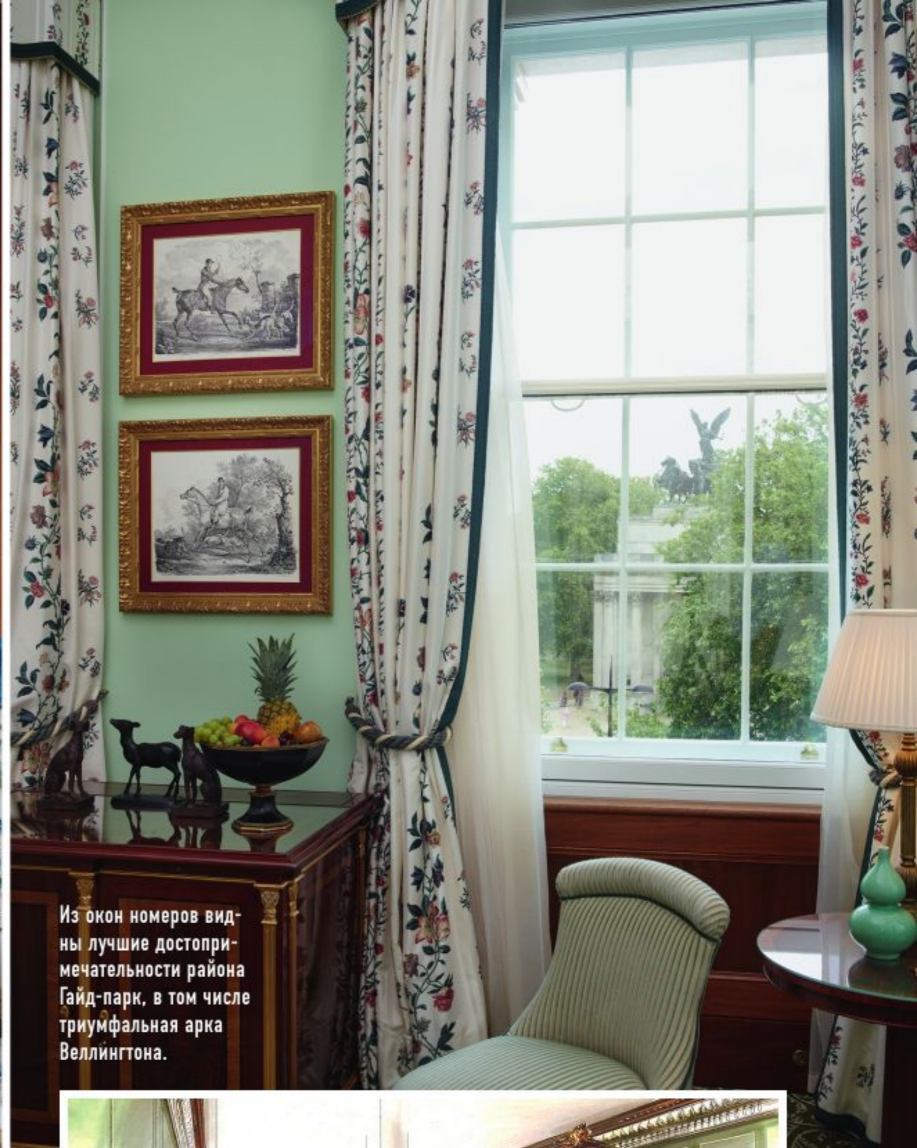
Из окон номеров видны лучшие достопримечательности района Гайд-парк, в том числе триумфальная арка Веллингтона.