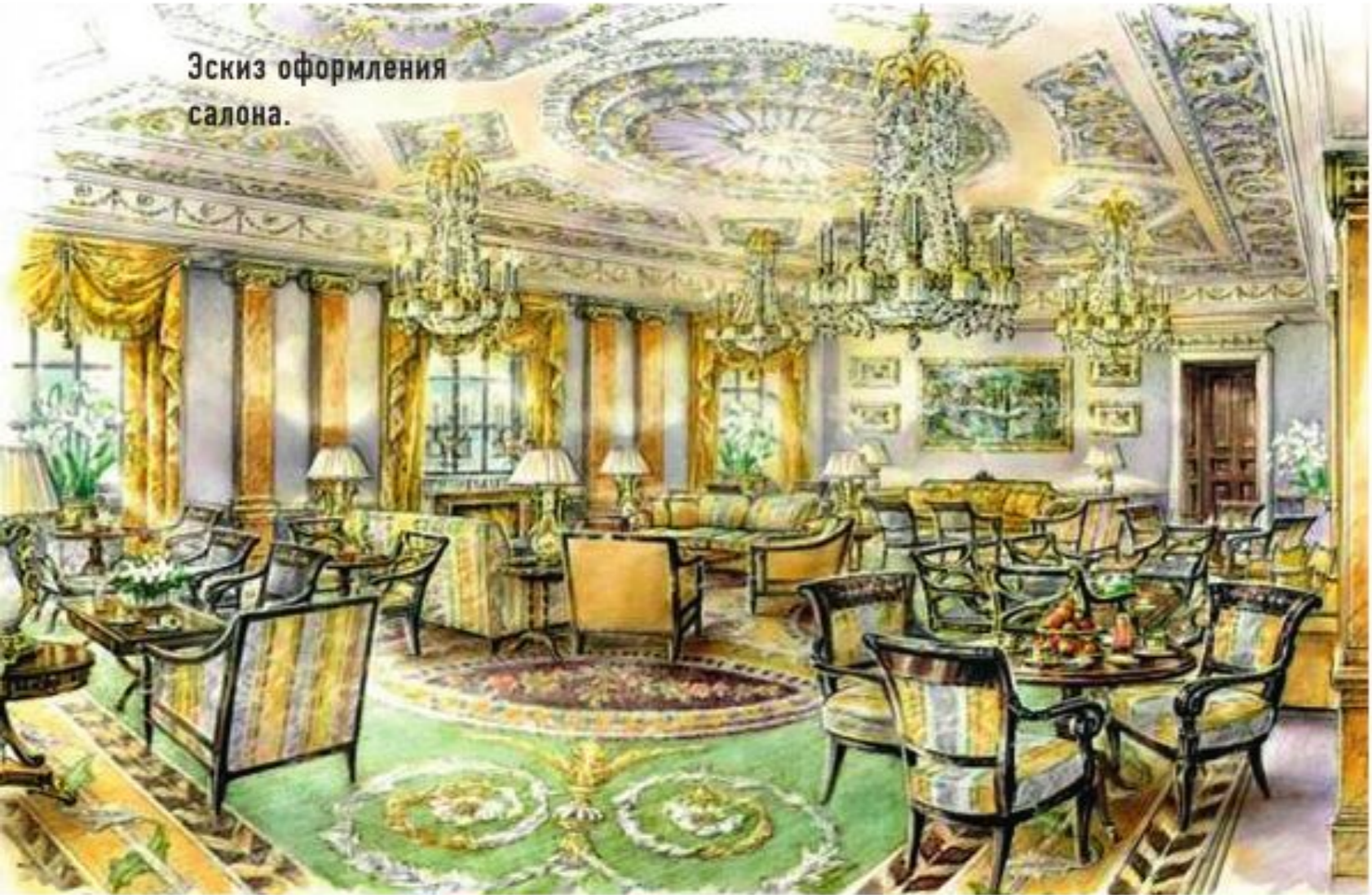
Эскиз оформления салона.

Больница продержалась в особняке XVIII века до 1980 года, когда она окончательно переросла свои площади и переехала в Тутинг. Судьба особняка Лейнсборо была неопределенной: он был в плачевном состоянии, стоял даже вопрос о возможном >