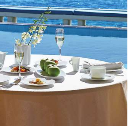
Вид на залив Мирабелло