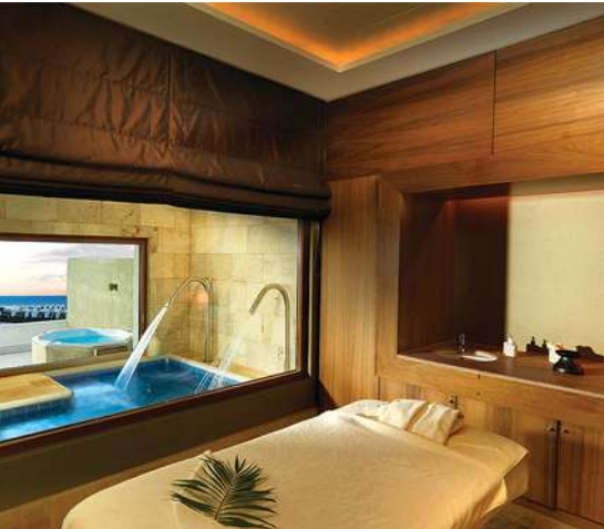
Спа-салон Six Senses