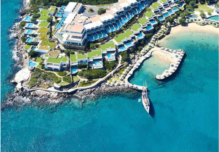
Территория отеля Elounda Peninsula All Suite