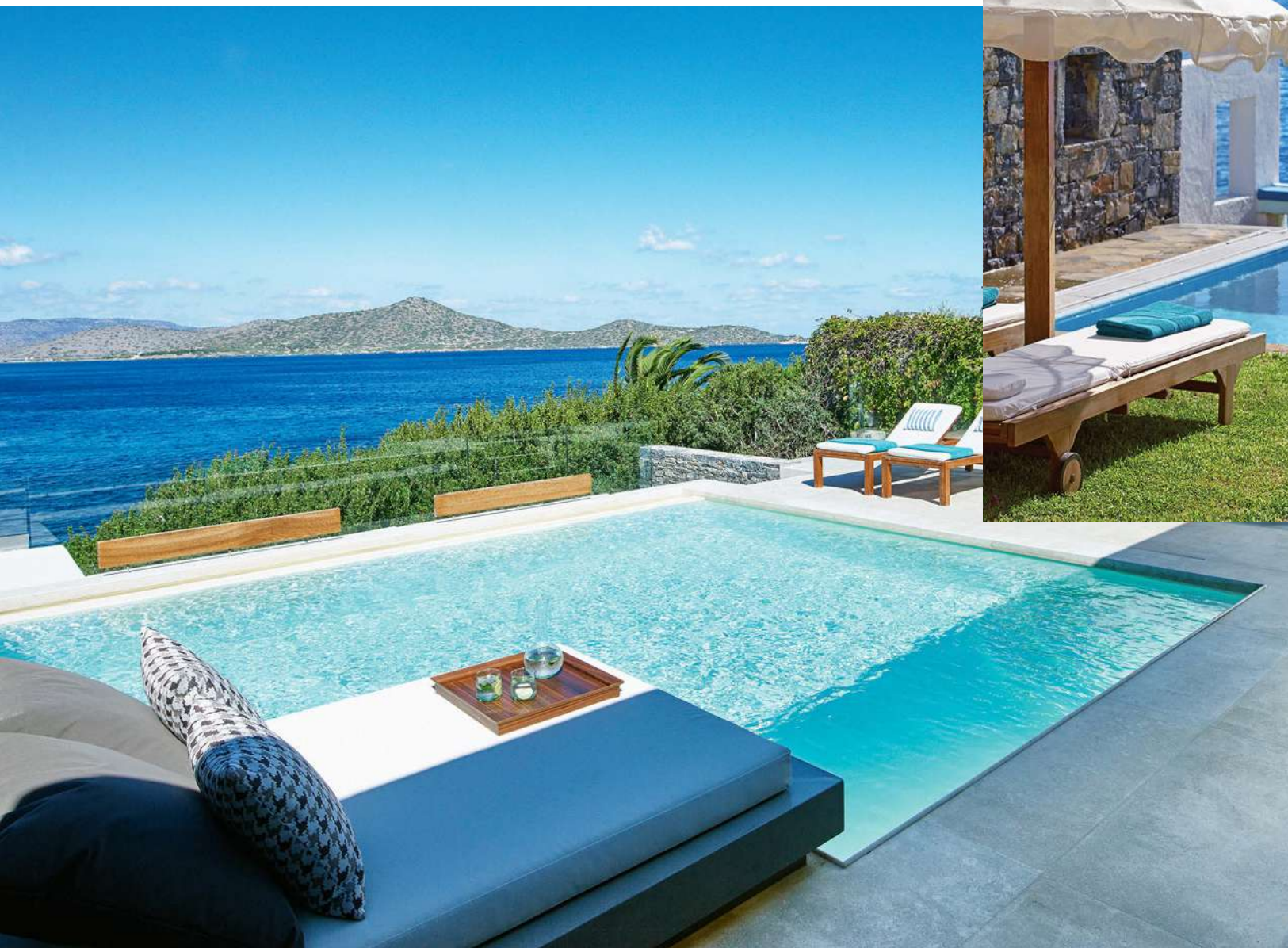
Бассейн на президентской вилле

Греческий Крит богат на безмятежные виды, сильные впечатления и новые открытия. Рассказываем, почему одним из таких может стать поездка в Elounda Peninsula All Suite и как местная жизнь поможет замедлиться хотя бы на время