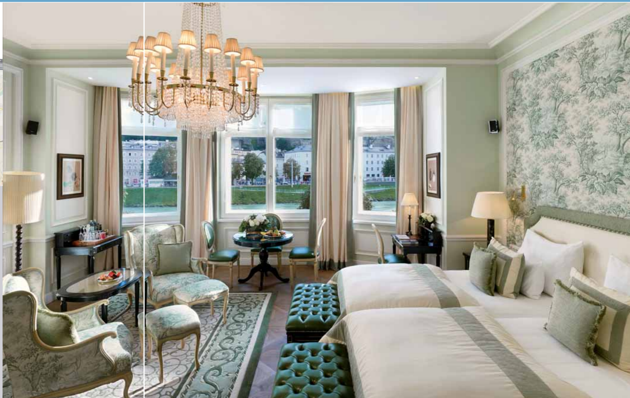
Слева Sacher Bar