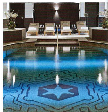
БАССЕЙН В ОТЕЛЕ. НИЖЕ: ЯЙЦО С ОВОЩАМИ.

И деальным для активного семейного отдыха L'Apogée Courchevel делает решительно все, в том числе расположение в самой крупной в мире горнолыжной зоне Les 3 Vallées. Более 600 километров трасс – аргумент, с которым совсем не хочется спорить. А еще местный детский клуб – абсолютный рекордсмен по площади на курорте. О том, что юных постояльцев в L'Apogée Courchevel ждет ни на что не похожий прием, легко догадаться в первые же минуты пребывания в отеле: здесь каждого ребенка лично приветствует мажордом, а затем вручает специальный паспорт. Дальше – больше: сюрпризы множатся на глазах. Моктейли, отдельный шведский стол, косметика в подарок. Любимое место встреч подростков 11–15 лет – клуб Free Style 1850 с пинг-понгом и сверкающим танцполом. Для детей помладше работает Mini VIP 1850, в центре которого стоит иглу, где можно смотреть любимые мультфильмы. Ну а для тех, кому совсем не сидится на месте, есть тематические экскурсии, дегустации местных продуктов и научно-популярные лекции. АЛЕНА СИЛЬНОВА