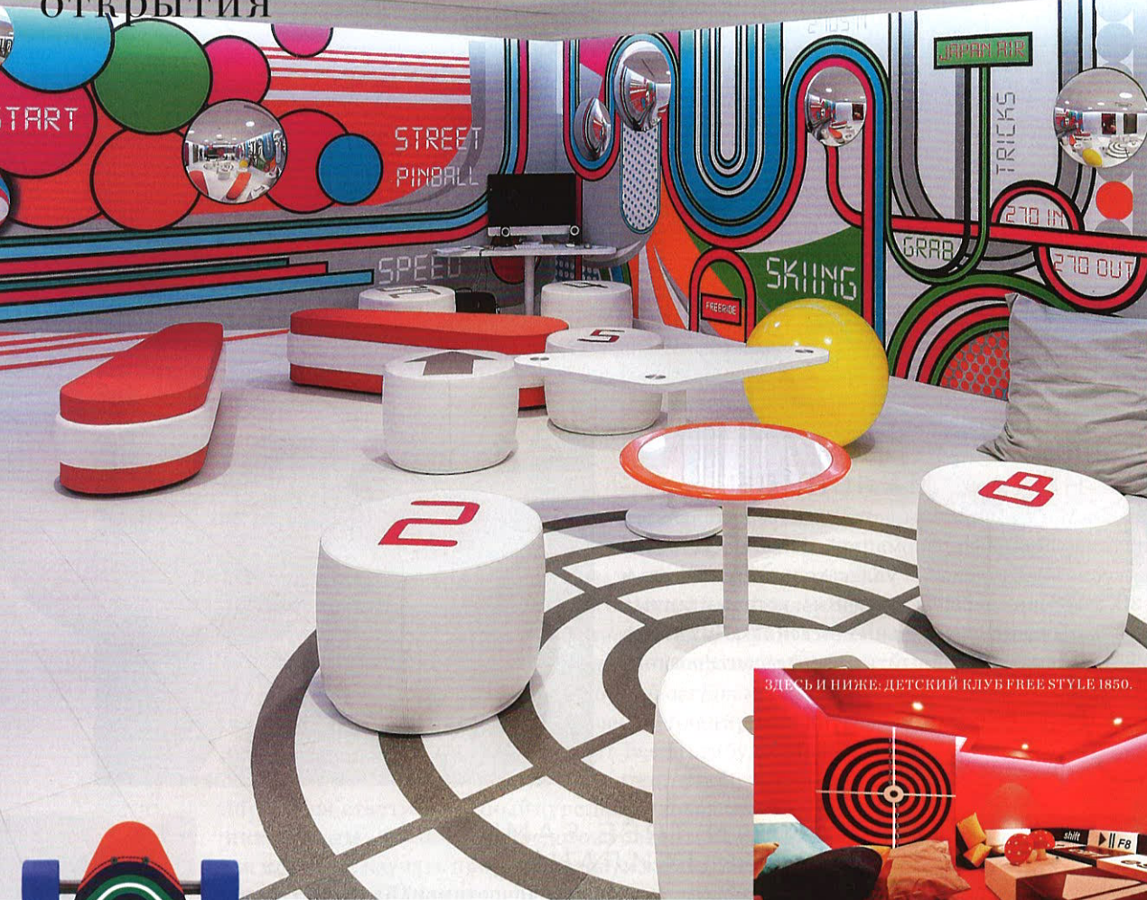
ЗДЕСЬ И НИЖЕ: ДЕТСКИЙ КЛУБ FREE STYLE 1850.