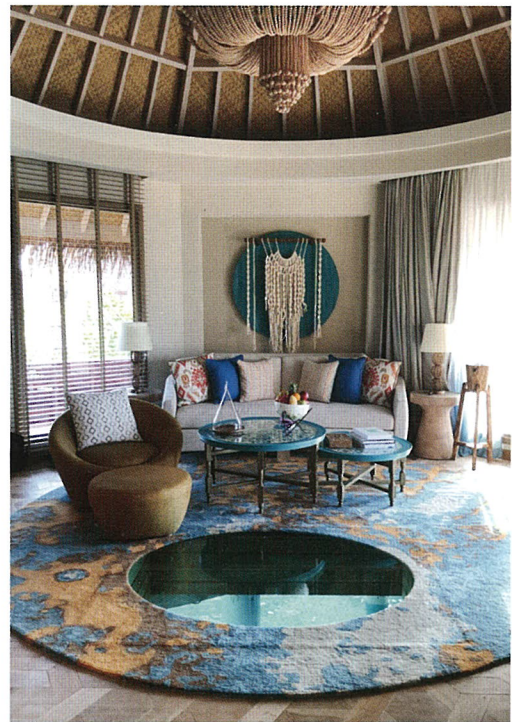
Панно ручной работы и гостиная 280-метровой виллы Ocean House, The Nautilus Maldives

в технике макраме. У вилл на воде есть еще одна оригинальная деталь: круглое окно на полу в гостиной, сквозь которое можно наблюдать за таинственной подводной жизнью.