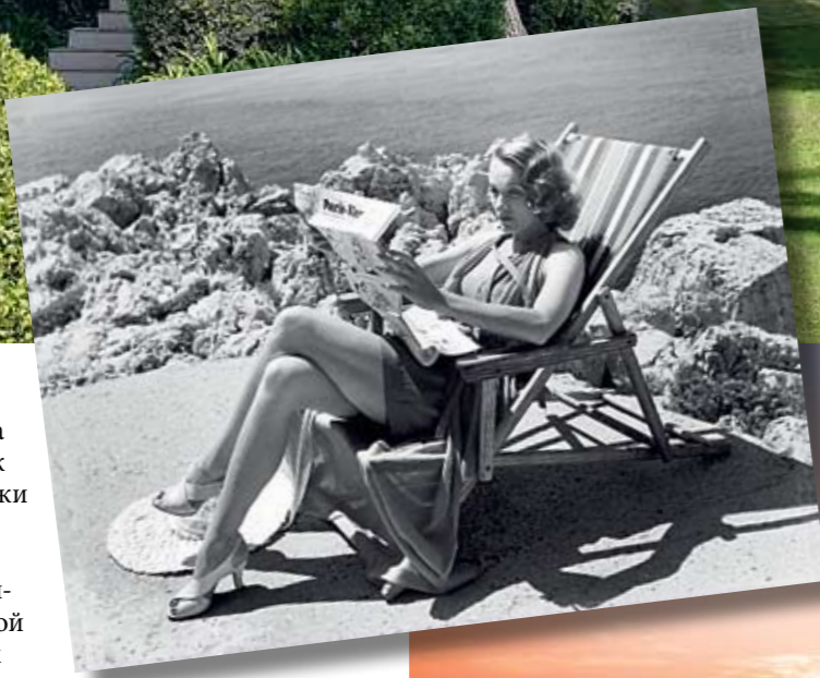
Марлен Дитрих отдыхает у бассейна