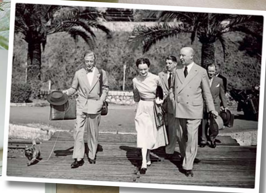
Герцог и герцогиня Виндзорские прибыли на отдых