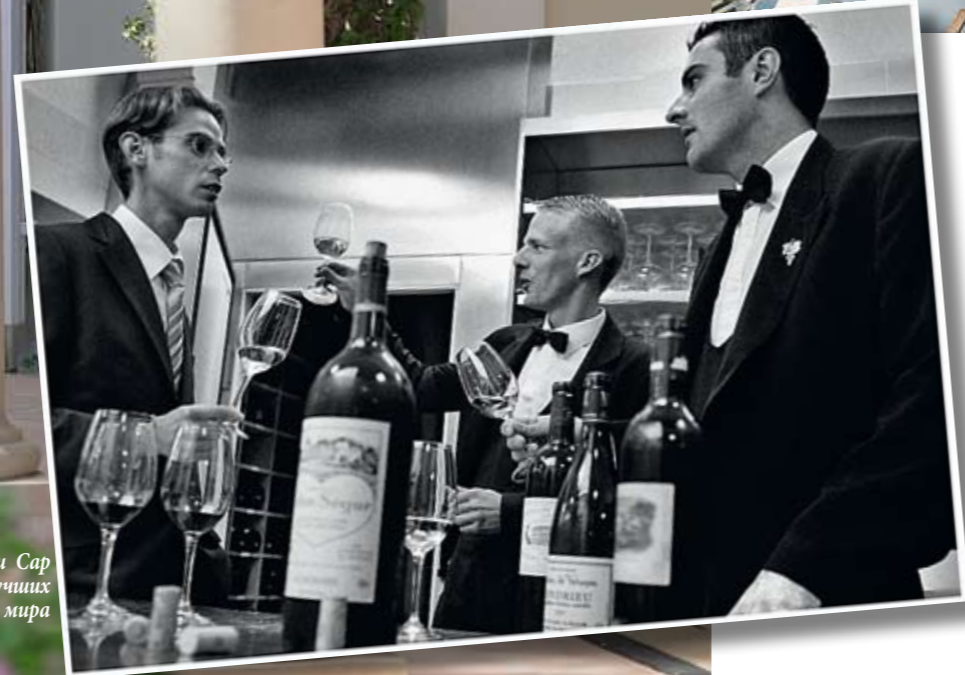
Собралием вин отеля Du Cap Eden-Roc заведует тройка лучших сомелье мира

ЯХТЫ СЫГРАЛИ ОПРЕДЕЛЯЮЩУЮ РОЛЬ В СУДЬБЕ DU CAP EDEN-ROC . ТОЧНЕЕ, ЯХТА, ПРОХОДИВШАЯ МИМО ОТЕЛЯ ЛЕТОМ 1965 ГОДА. РУДОЛЬФ ОТКЕР , НАХОДИВШИЙСЯ НА БОРТУ, ТАК ВПЕЧАТЛИЛСЯ УВИДЕННОЙ КРАСОТОЙ, ЧТО РЕШИЛ ПРИОБРЕСТИ ОТЕЛЬ В СОБСТВЕННОСТЬ