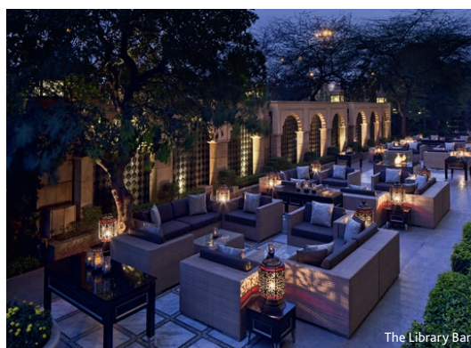
The Library Bar