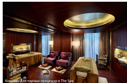
Комната для парных процедур в The Spa