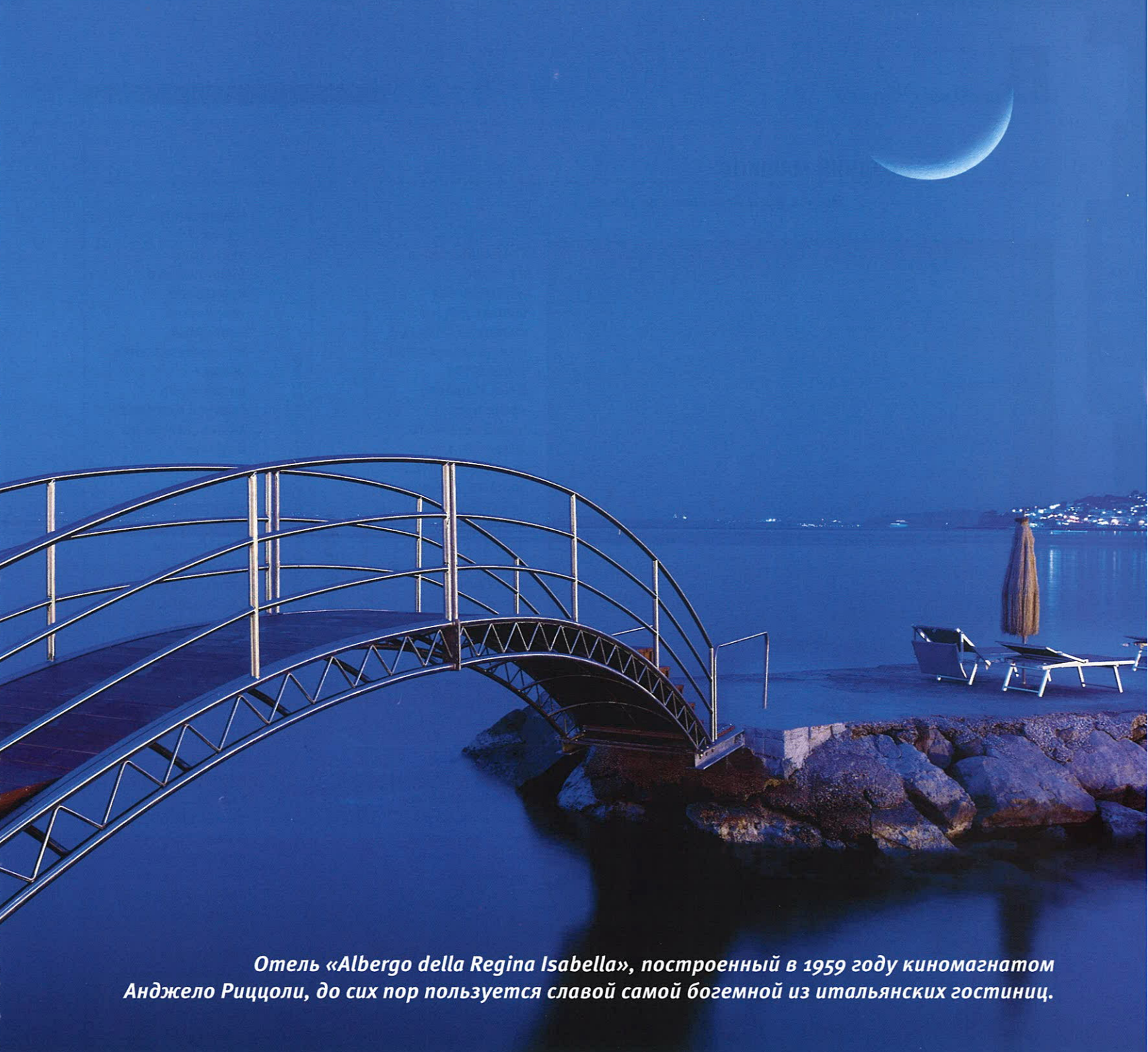
Отель «Albergo della Regina Isabella», построенный в 1959 году киномагнатом Анджело Риццолли, до сих пор пользуется славой самой богемной из итальянских гостиниц.