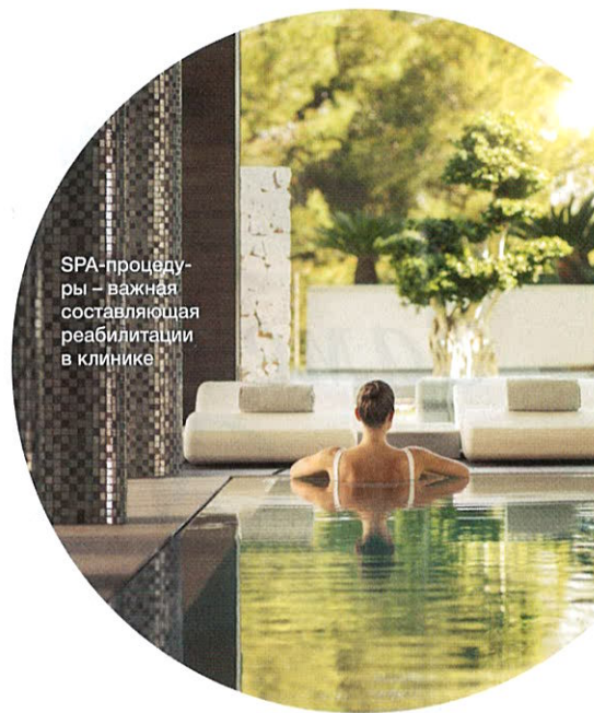
SPA-процедуры – важная составляющая реабилитации в клинике

чтобы дома вы могли продолжить придерживаться данной системы питания. Второе, что входит в любую программу, – это оздоравливающие активности: от скандинавской ходьбы, бега и фитнеса до йоги, гимнастики цигун и медитаций. Ну а дальше все индивидуально: кому – энергетические массажи и иглоукальвание, а кому – эстетическая медицина, которая здесь, что редкость, стараются использовать инвазивные процедуры по минимуму. В общем, можно без преувеличения сказать: в Sha вам подарят новую жизнь и, более того, научат, как продолжать ей жить дома, в обычных – городских – условиях. ☺