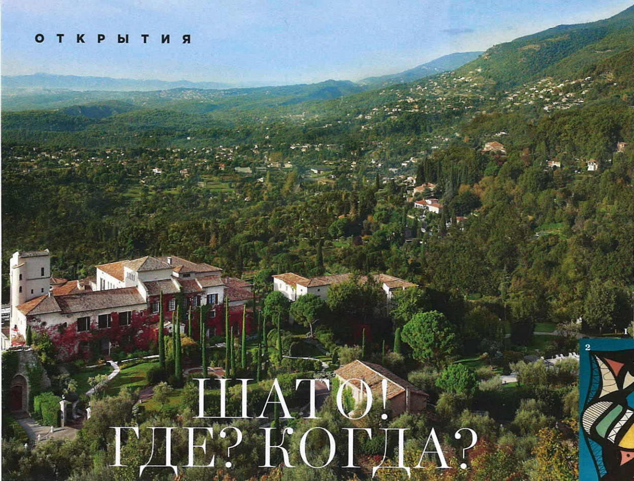
1 ВИД НА CHÂTEAU SAINT-MARTIN & SPA. 2, 4 РАБОТЫ ЭРИКА ИФЕРГАНА. 3 ЧАСОВНЯ В CHÂTEAU SAINT-MARTIN & SPA, РАСПИСАННАЯ ЭРИКОМ ИФЕРГАНОМ.