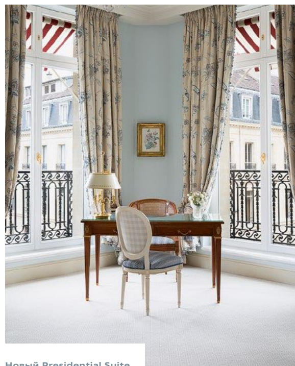
Новый Presidential Suite