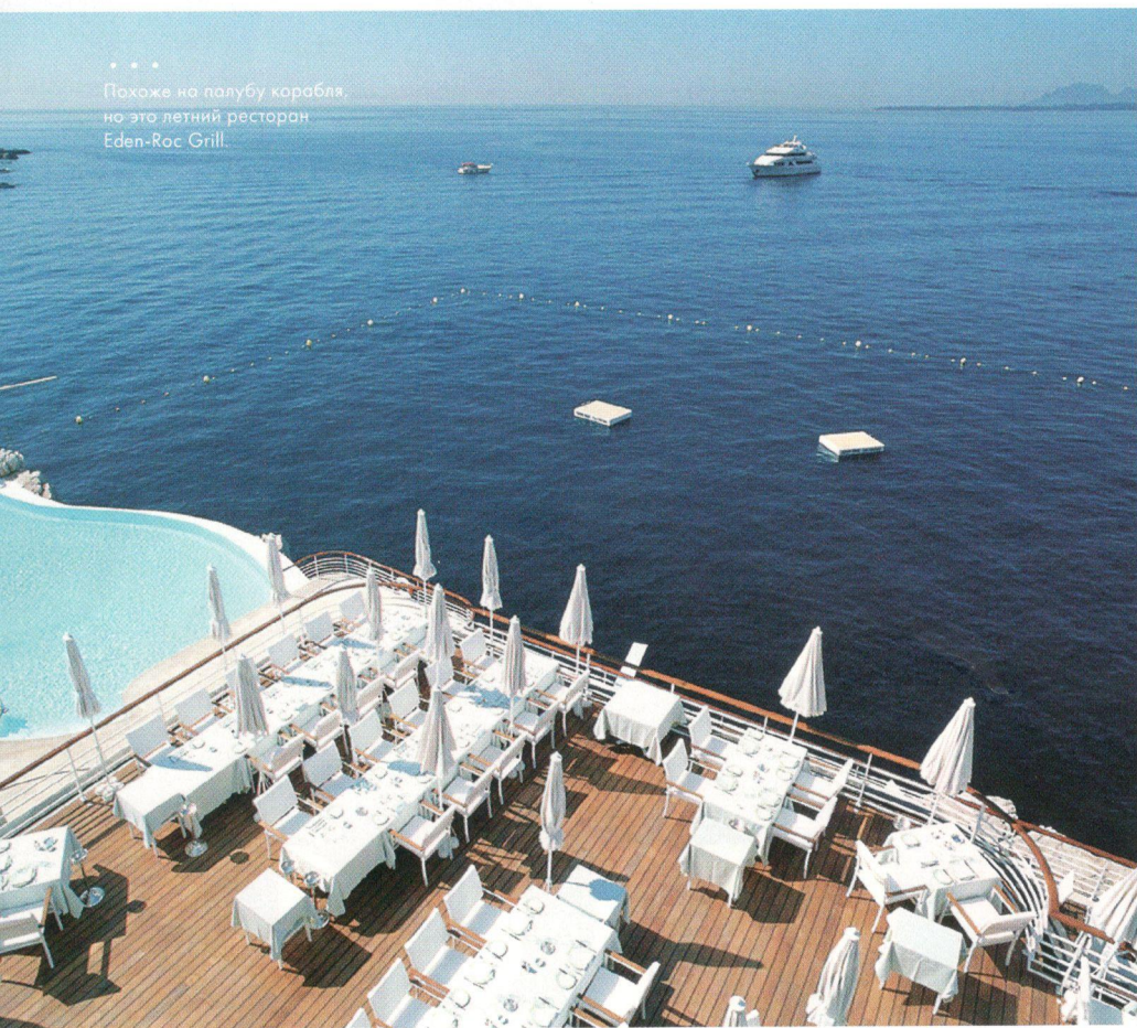
Похоже на палубу корабля, но это летний ресторан Eden-Roc Grill.

P.P.S. На молодых женихов из Киева это тоже распространяется. ☺