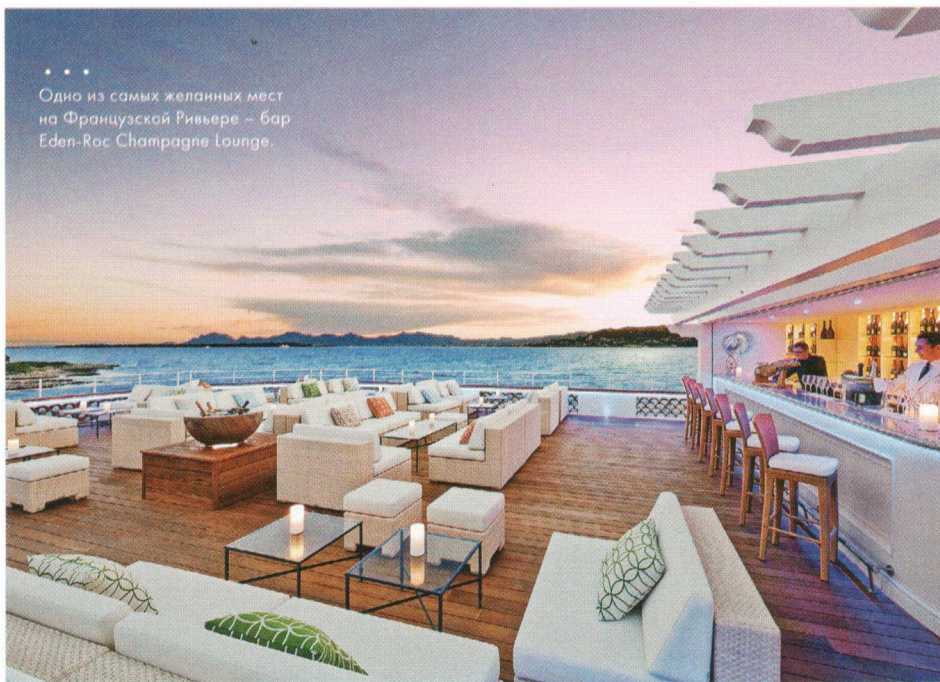
Одно из самых желанных мест на Французской Ривьере – бар Eden-Roc Champagne Lounge.