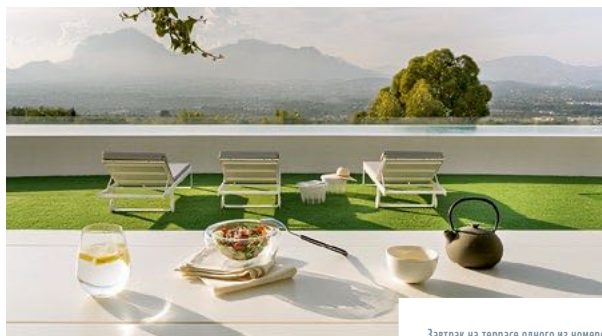
Завтрак на террасе одного из номеров