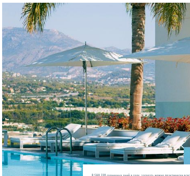
В SHA 330 солнечных дней в году, загорать можно практически всегда

Подытоживая, хочется сказать, что SHA Wellness Clinic — то место, куда точно следует поехать и куда вам обязательно захочется вернуться.