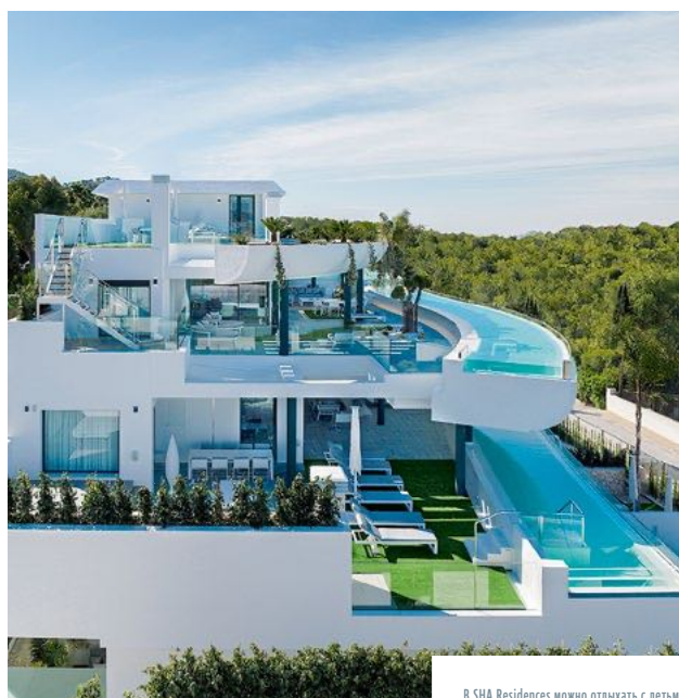
В SHA Residences можно отдыхать с детьми