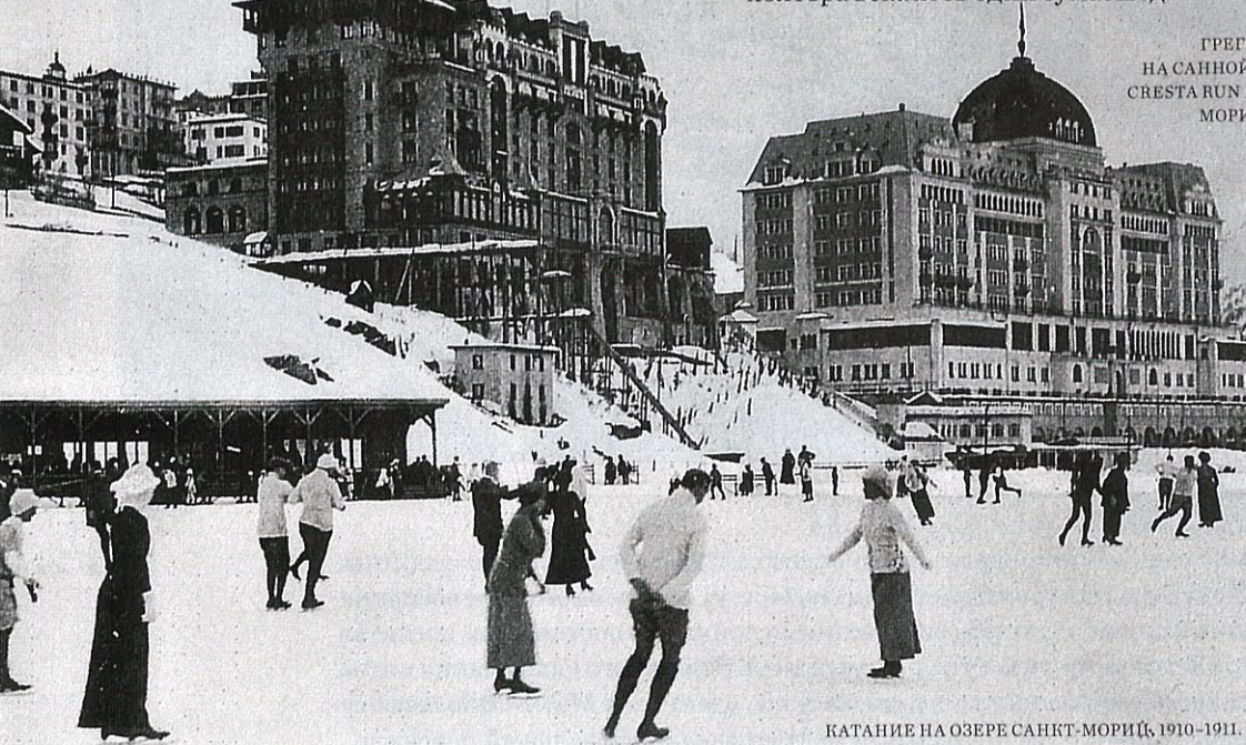
КАТАНИЕ НА ОЗЕРЕ САНКТ-МОРИЦ, 1910–1911.

ГРЕГОРИ ПЕК НА САННОЙ ТРАССЕ CRESTA RUN В САНКТ- МОРИЦЕ, 1955.