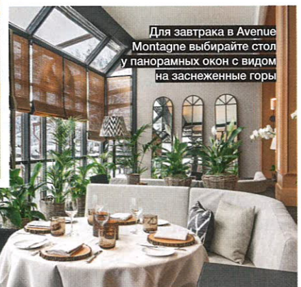
Для завтрака в Avenue Montagne выберите стол у панорамных окон с видом на заснеженные горы

В 15 минутах езды от отеля находится временный арт-объект американского художника Дуга Эйткена – Mirage Gstaad. Название его неслучайно: дом выполнен в традиционном швейцарском стиле, но из зеркал, поэтому, словно мираж, сливается с окружающим пейзажем. Вход свободный.