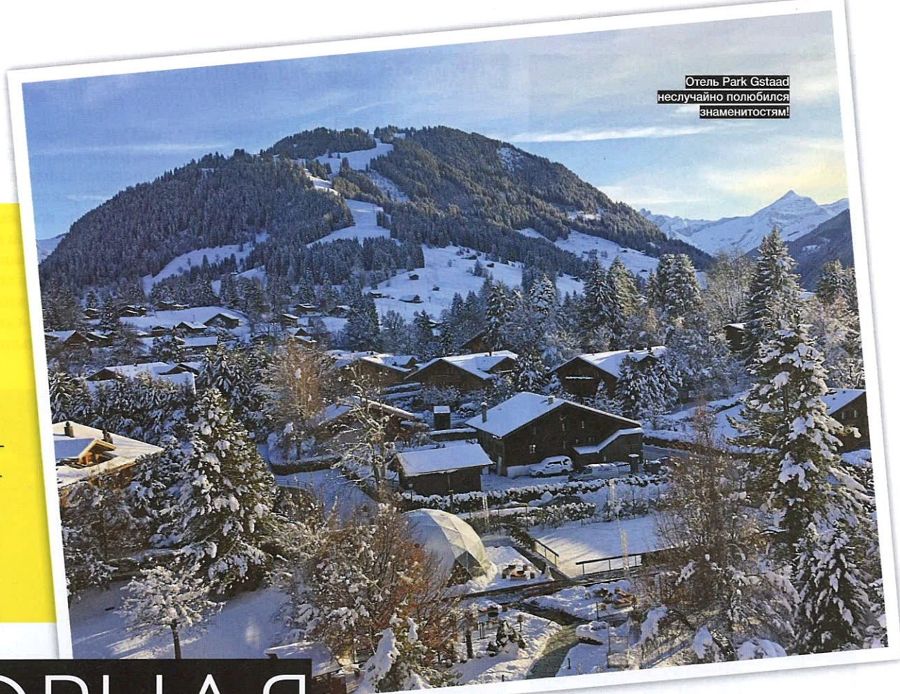
Отель Park Gstaad неслучайно полюбился знаменитостям!

Соскучились по снегу? Тогда GRAZIA предлагает отправиться в отель Park Gstaad в сердце знаменитого горнолыжного курорта Швейцарии.