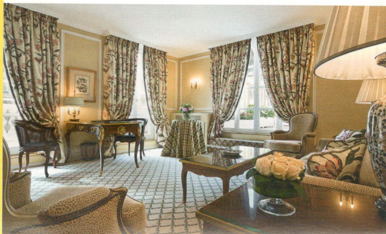
Le Bristol – удивительным образом роскошный и уютный одновременно

Каждый из нас хранит в памяти любимые города, куда хочется возвращаться снова и снова. Такие фавориты есть и у редакторов GRAZIA – мы решили ими с вами поделиться.