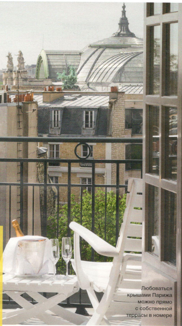
Любоваться крышами Парижа можно прямо с собственной террасы в номере

Рестораны под предводительством великого Эрика Фрешона – особенно награжденный тремя звездами «Мишлен» Epicure: в нем даже на завтрак собираются самые модные персонажи города! В теплое время года обязательно закажите столик в саду. Ну и еще не могу не упомянуть бассейн с панорамными окнами и видом на Эйфелеву башню, расположенный под крышей отеля.