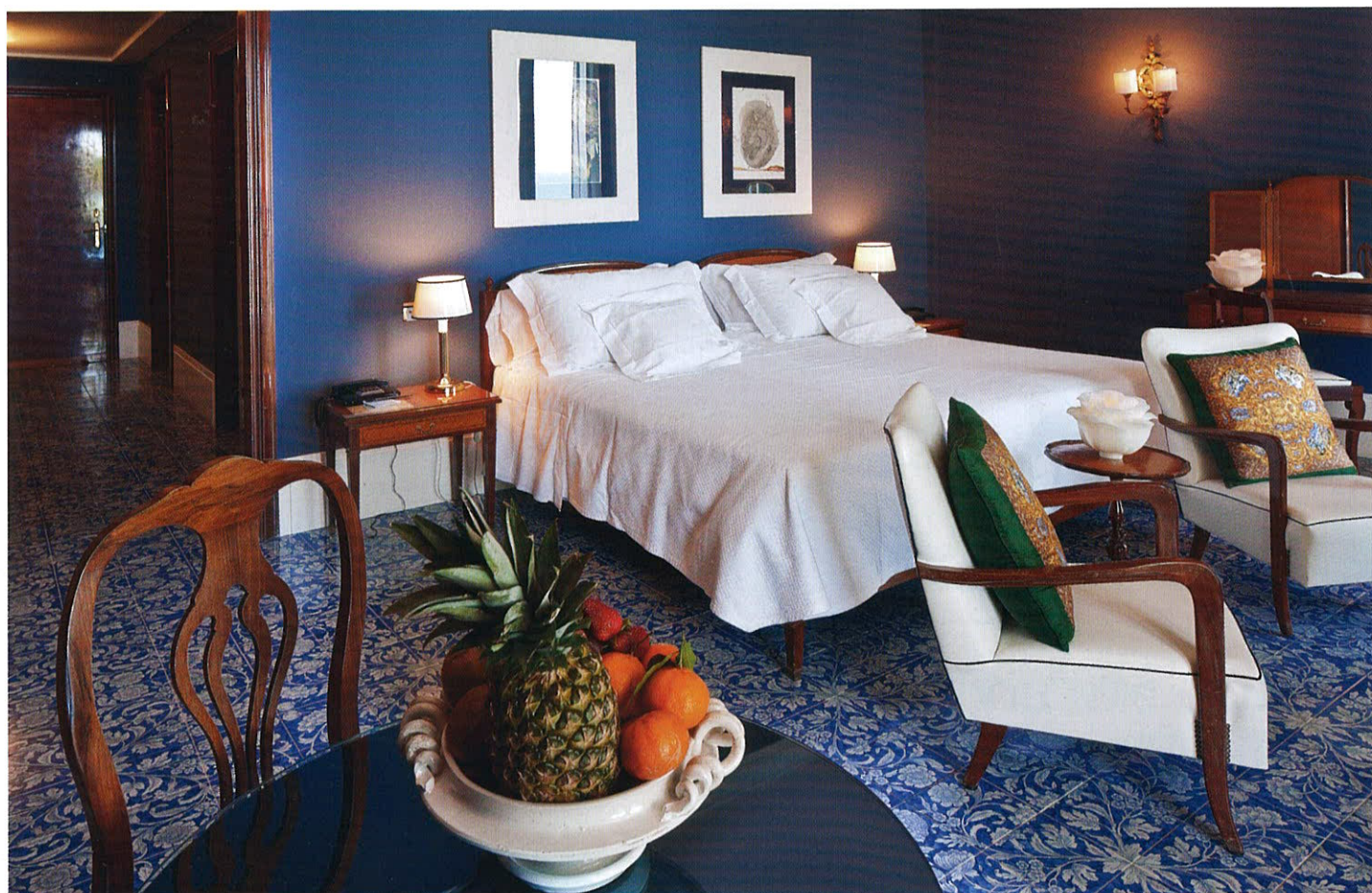
На фото Каждый номер L'Albergo della Regina Isabella оформлен традиционной искиганской плиткой. Ни в одной из комнат узор не повторяется. На фото – номер категории deluxe .

значит, что вас не поселят в отель с детьми, но вы же знаете, что даже «маленькие английские лорды» под ярким солнцем и вблизи от лазурного моря склонны шумно выражать свой восторг. И дабы не ловить на себе взгляды, брошенные поверх огромных темных очков, в Regina Isabella стоит привезти детей, когда они подрастут. Надо добавить, что и отель, и остров в целом благоволят эгоистичному отдыху: здесь слишком много возможностей заняться собой. Например, в L'Albergo della Regina Isabella пара дней уйдет только на то, чтобы испытать на себе целительную силу частных термальных бассейнов и составить расписание спа- или лечебных процедур. Ведь здесь делают не только прекрасные уходы, массажи и прочие тритменты, способствующие сохранению молодости, красоты и душевного равновесия. Вокруг термальных бассейнов отеля сформировался небольшой медицинский центр. А если у вас есть определенные жалобы, вас направят в общественный термальный комплекс Gardini Poseidon : состав местной воды может оказаться спасительным при целом ряде недугов. Когда у вас появится желание, наконец, явить свое улаженное массажами и подтянутое лимфодренажными