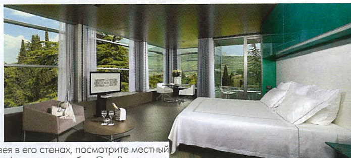
Мягкие тона и чистые линии характерны для дизайна всех номеров отеля, включая 34 комнаты double, deluxe, junior suite и 8 роскошных executive suite

зая в его стенах, посмотрите местный кафедральный собор Сан-Виджилио с прилегающей к нему Пьяцца Дуомо и фонтаном Нептуна в стиле неоклассицизма, зайдите во дворец-крепость Палатцо делле Альбере, в котором сейчас находится музей современного искусства. Зимой Тренто преобразается: на главной площади разворачиваются рождественские рынки, а улицы заполняют лыжники, направляющиеся к трассам в горных поселениях Пинцоло и Мадонна-ди-Кампильо. Не забудьте захватить местную трентийскую граву, которую готовят на основе фруктов и трав. Вернувшись в отель после насыщенного дня, первым делом отправляйтесь в гидромассажный бассейн или на расслабляющую процедуру в спа Centoundici — например, на основе эксклюзивной линии с экстрактом белого винограда. Вечерний аперитив — незываемая традиция по всей Италии, и Рива-дель-Гарда не исключение. Начать стоит в Bar Balli при Lido Palace с од-