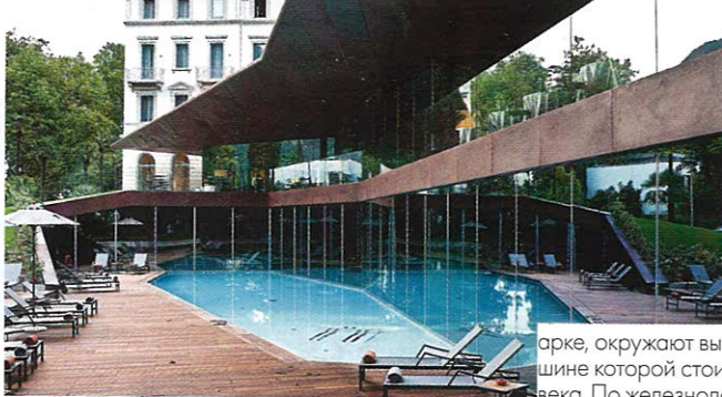
Бассейн Lido Palace состоит из двух частей — открытой и закрытой. Благодаря подогреву здесь можно купаться уже в апреле.

в отмеченном звездой Michelin ресторане Mirabelle в Риме, знает свое дело. В меню — средиземноморская классика, но ставку лучше сделать на местные сезонные рецепты: кролика с полентой из Трентино, молотой на камне по старинной технологии, домашнюю пасту с дикой спаржей и местные сыры для завершения трапезы. Именно здесь стоит попробовать оливковое масло Garda DOP, производимое из выращенных на озере оливок, и региональное игристое Trentodoc — изготовленное классическим методом шампанизации вино из Трентино, объединяющее нескольких производителей. Еще один обязательный пункт дегустации — уникальный сыр Trentingrana, местная вариация выдержанного Grana Padano, который делают из ароматного молока горных коров. Как ни удивительно, на берегах Гарды производят также характерный для итальянского юга лимончелло — в городке с говорящим названием Лимоне. Все эти специалитеты можно купить в одном из многочисленных гастрономических магазинчиков Ривы на центральной прогулочной Виале Данте Алигьери и на Виа Фьюме. Лабиринты извилистых улочек Гарды, где даже в сезон нет толп туристов, можно обойти за день, но спешить здесь ни у кого не возникает желания. Изучив город, займитесь водным спортом: местный парусный клуб Fraglia Vela Riva, основанный еще в 1920 году, проводит регаты на яхтах J/80 и курсы выходного дня для детей и взрослых. Альтернативой станет прогулка по ближайшим городам. Первая остановка — Арко в живописной долине. Здания города, подобно