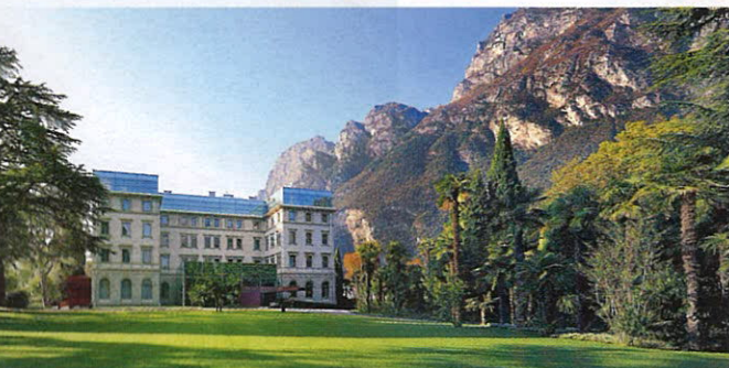
Площадь парка при Lido Palace составляет 12,5 тыс. кв. м

модернистских конструкций из стекла и металла, которые образовали единое целое не только с классической архитектурой старинного здания отеля, но и с окружающим ландшафтом. По мнению Чеккетто, настоящая роскошь сегодня заключается в ощущении полной приватности, в возможности полностью погрузиться в природу. Что ж, ему это удалось: обедая на террасе Lido Palace среди зеркальных стен, отражающих голубизну бассейна, яркую средиземноморскую зелень набережной и бескрайние воды озера, можно ощутить абсолютную гармонию Гарды. Кстати, насчет обеда. Как бы ни заманивали уютные домашние trattorie в историческом центре Ривы, перед ланчем в изысканном Tremani Bistrot при отеле просто невозможно устоять — особенно если его сервируют на свежем воздухе в солнечный день. Шеф Lido Palace Джузеппе Сесито, ранее работавший