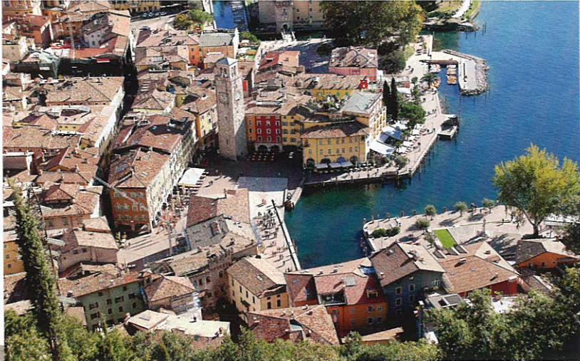
Двери в номера Lido Palace оформлены в виде старинных открыток с пейзажами Ривы начала XX века