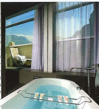
Закаты на озере Гарда — идеальный кадр для инстаграма

зая в его стенах, посмотрите местный кафедральный собор Сан-Виджилио с прилегающей к нему Пьяцца Дуомо и фонтаном Нептуна в стиле неоклассицизма, зайдите во дворец-крепость Палатцо делле Альбере, в котором сейчас находится музей современного искусства. Зимой Тренто преобразается: на главной площади разворачиваются рождественские рынки, а улицы заполняют лыжники, направляющиеся к трассам в горных поселениях Пинцоло и Мадонна-ди-Кампильо. Не забудьте захватить местную трентийскую граву, которую готовят на основе фруктов и трав. Вернувшись в отель после насыщенного дня, первым делом отправляйтесь в гидромассажный бассейн или на расслабляющую процедуру в спа Centoundici — например, на основе эксклюзивной линии с экстрактом белого винограда. Вечерний аперитив — незываемая традиция по всей Италии, и Рива-дель-Гарда не исключение. Начать стоит в Bar Balli при Lido Palace с од-