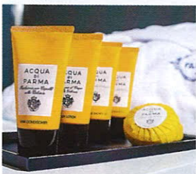
Косметика Acqua di Parma в номере Lido Palace