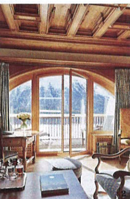
1 ЗОНА БАСЕЙНА. 2 ОДИН ИЗ СЬЮТОВ ОТЕЛЯ. 3 АРХИВНАЯ ФОТОГРАФИЯ ОТЕЛЯ.