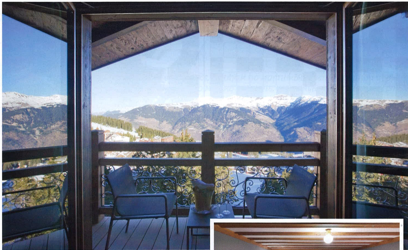
Вид с террасы

Вышколить команду перед открытием нового места до такой степени, чтобы самые требовательные клиенты не нашли, к чему придраться, невозможно. Но в случае с отелями Oetker Collection чудо произошло, поскольку в данном случае чудом его можно назвать ровно настолько же, насколько подходит под это определение действия искусного иллюзиониста, который не создает предметы из воздуха, а лишь перемещает