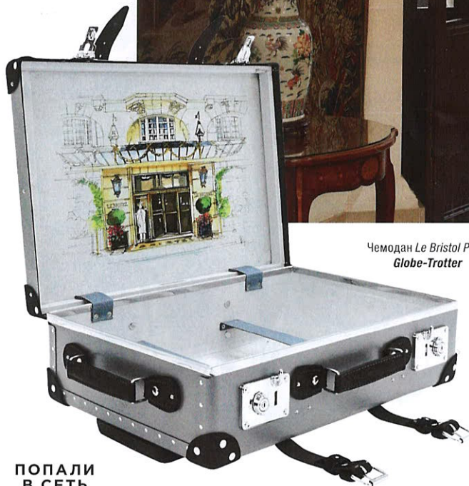
Чемодан Le Bristol Paris , Globe-Trotter