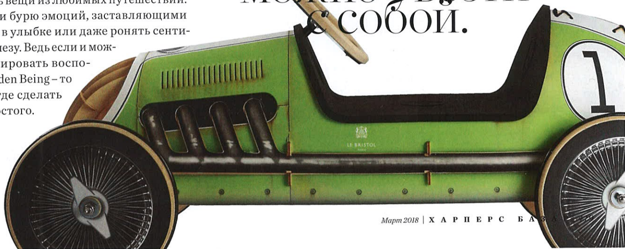
Детский электромобиль Phim Push-car Le Bristol Paris kit

Мебель эпохи Людовика XV, восточные ковры, люстры ручной работы – теперь все это МОЖНО УВЕЗТИ С СОБОЙ.